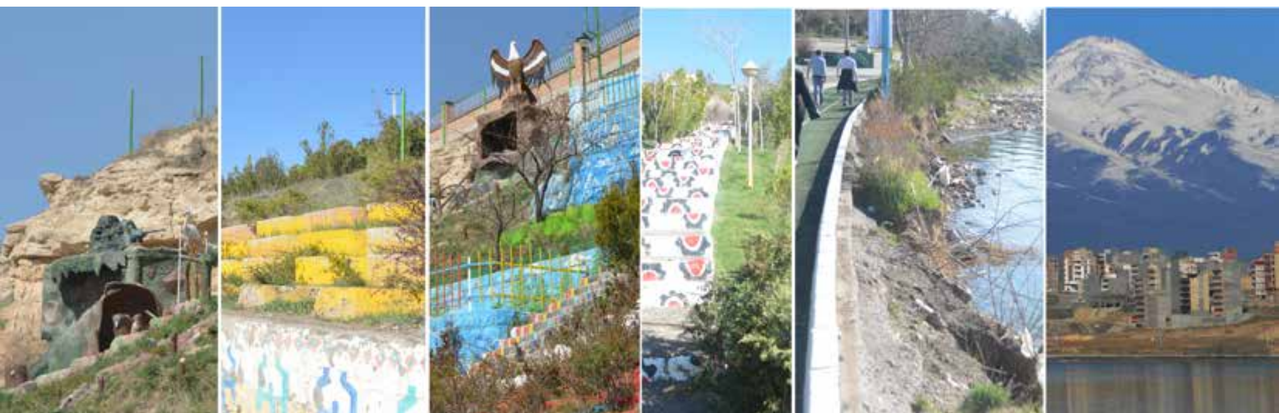
تصویر ۴: غلبه نگاه کالبدی و کارکردی در پاسخ به نیاز مخاطبان.