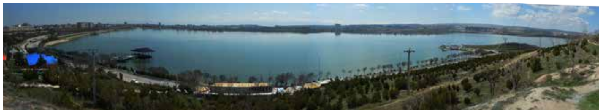
تصویر ۵: عدم یکپارچگی منظر، تحمیل زیبایی کالبدی و کارکردی در مبلمان و طرح کاشت. عکس: احسان کرامتی، ۱۳۹۶.

شهر چنان موجود زنده در دیالکتیک دائم با طبیعت در طول زمان تغییر، تحول، رشد و توسعه می یابد. لبه شهر، منطقه گذار از مصنوع به طبیعت به دلیل ظرفیت بالا، همواره از اهمیت بالایی برخوردار بوده است. لبه ای که فرصت مواجهه شهروندان با طبیعت را فراهم می کند. بررسی امر زیبایی در رویکردهای دوره معاصر در این فضا، گذار از زیبایی کارکردی-کالبدی به زیبایی معناگرا را نشان می دهد. ارتباطی بی واسطه و یکپارچه بین شهر و طبیعت که نیازهای کمی مخاطبانش را هم زمان از خلال مدیریت کیفی فضاها، در راستای فضاهای جمعی هویت مند پاسخ می دهد. قلمرو دریاچه شورابیل شهر اردبیل یکی از این لبه های مهم ارتباط شهر و طبیعت است که باوجود