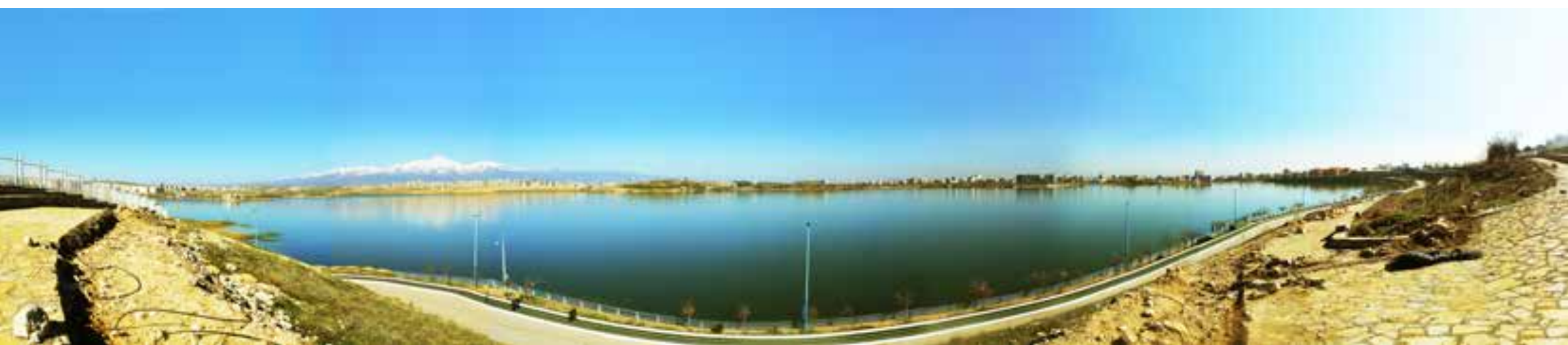
تصویر ۳: عدم مدیریت لبه و کیفیت نظرگاهی دریاچه شورابیل.

مصنوعی، ترانشه سنگی و حصار فلزی ارزش‌های منظر ساحل با زیبایی هویتی و خاطره ساز لبه را تقلیل داده و با ایجاد مسیر یکنواخت سلامت و مرزبندی و تفکیک عملکردهای پیاده، دوچرخه، درشکه، انعطاف فضایی را در ارتباط با طبیعت از بین می‌برد. گرچه امروز به دلیل ترجیحات اقتصادی و مشکلات مالکیتی طرح آتک از طرف شهرداری پذیرفته‌نشده است ولی شاهد اجرای طرح‌های مختلف از طرف خود کارفرما هستیم که با تعریف فضای باز اطراف دریاچه به صورت عرصه عمومی با عنوان عام «فضای سبز» متأثر از چشم‌انداز افق ۱۴۰۴ برای شهر، موجب تعریف پروژه‌هایی است که فاقد یکپارچگی و تنوع لازم برای نقش‌آفرینی در مقام نوعی مرکزیت تفریحی معنامند هستند. عدم شناخت درست از روح فضاها (ایجادشده) چون