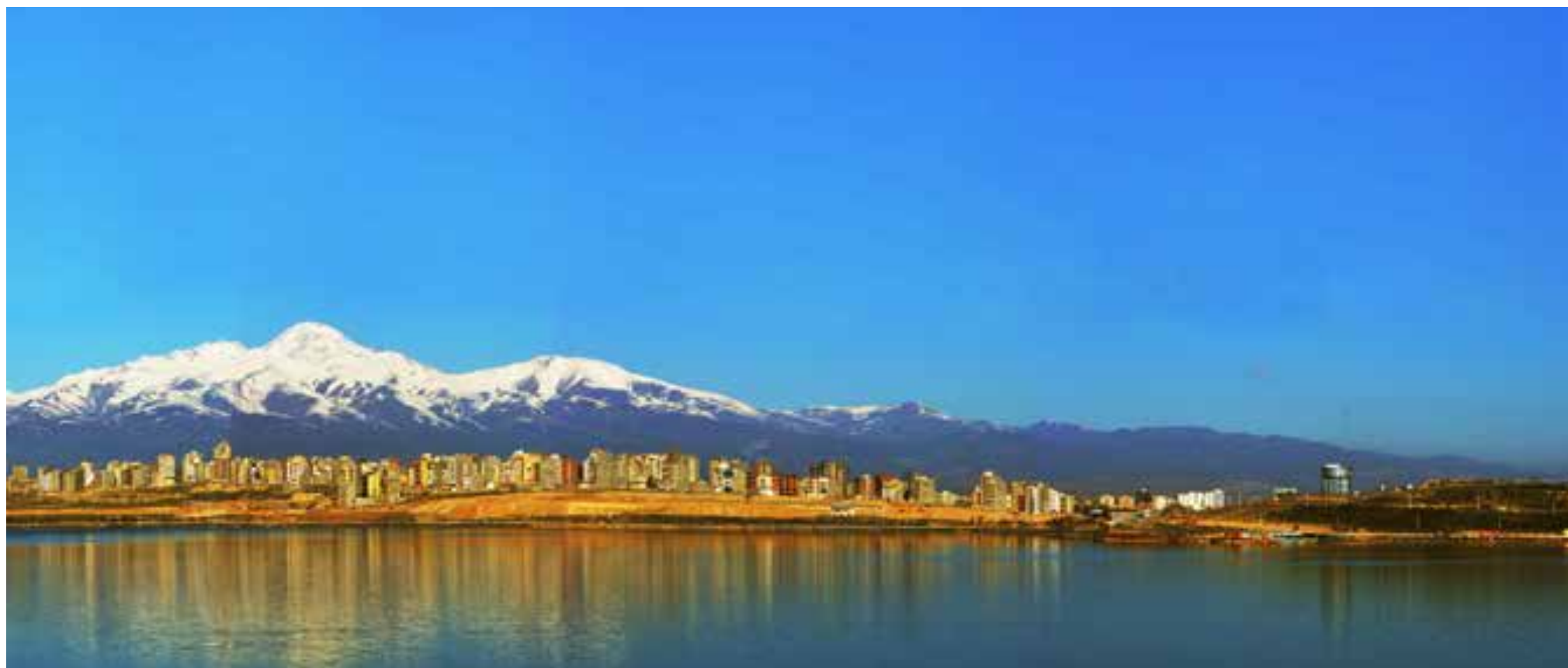
تصویر ۱: اغتشاش بصری و عدم عدالت فضایی لبه دریاچه. عکس: احسان کرامتی، ۱۳۹۶.

ویژگی‌های اکولوژیکی ضمن از بین بردن خاصیت درمانی و زیستی و تعریف میکرو اقلیم کوچکی برای گونه‌های جدیدی از گیاهان، حیوانات و پرندگان، ذهنیت حاصل از نام شورابیل متأثر از شور بودن دریاچه که روزی وجه تسمیه این دریاچه بود را نیز دستخوش تغییر کرد. از مهم‌ترین پیشنهادهای آمایش سرزمین در ۱۳۸۳ تقویت امکانات و تأسیسات گردشگری است (مهندسین مشاور عرصه، ۱۳۹۰: ۹۹) که در سال‌های بعد با مطرح کردن بهره‌برداری از ظرفیت‌های چندگانه و منحصر به فرد شهر در قالب طرح‌های توسعه، مسئله تازه‌ای در ارتباط با این لبه برای شهر تعریف می‌شود. در طرح‌های بالادست، اردبیل شهر پیشرو در قطب‌های گردشگری استان و از مهم‌ترین قطب‌های گردشگری شمال غربی کشور است. شهر اردبیل به‌عنوان شهری با نقش ارتباطی برجسته، پیوندگاه شهر، طبیعت و تاریخ و... با تکیه بر الگوی باغشهر و توسعه روستا شهری معرفی شده است. با این چشم‌انداز، پهنه ویژه گردشگری اردبیل با رویکرد حفظ و تقویت جایگاه گردشگری و تفرجگاهی طبیعی موجود در شهر اعم از دریاچه شورابیل، بالیخلو چای و نهرهای غربی و شمال غربی شهر مطرح می‌شود (همان: ۱۶۱).