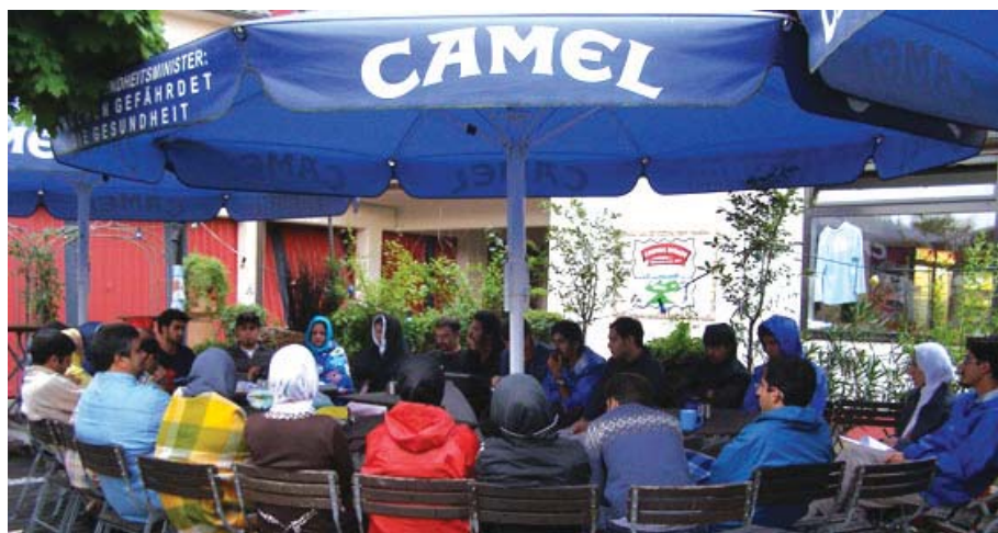
جلسه مباحثه عمومی در خصوص یافته‌های علمی سفر و برنامه‌ریزی آن، کمپ برگر (Berger Camping) در برگر، سفر اروپای شرقی و مرکزی، تابستان ۸۷، مأخذ: مریم قندهاریون.