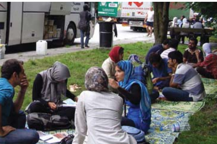
برگزاری جلسات علمی گروهی در زمان‌های پیش‌بینی شده برای فعالیت‌های پژوهشی، مرز آتریش، سفر اروپای شرقی و مرکزی، تابستان ۸۷،

بررسی نظریات مختلف این نکته را روشن می‌سازد که هر قدر معلم‌ها درک روشن‌تری از تعلیم و تربیت داشته باشند، فرایند یادگیری را صحیح‌تر دنبال می‌کنند. «شریعتمداری» معتقد است در گذشته تصور می‌شد که تعلیم و تربیت یعنی انتقال معلومات، روی همین اصل، کار عمده مدرسه عبارت بود از انتقال میراث فرهنگی گذشتگان به شاگردان؛ اما وی اضافه می‌کند که محدود نمودن تعلیم و تربیت به انتقال میراث فرهنگی صحیح نیست (شریعتمداری، ۱۳۸۴: ۲۸). «جان دیویی» از دیگر اندیشمندان این حوزه، تعلیم و تربیت را جریانی مانند رشد فرض می‌کند و آن را تجدید نظر