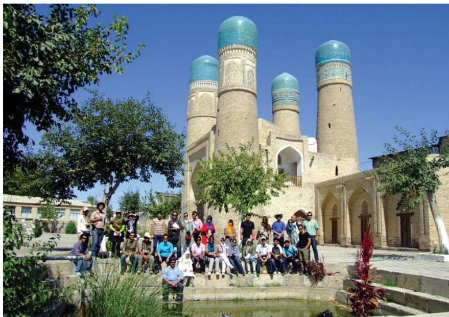
بازدیدهای گروهی و روابط اجتماعی اعضا در سفر، چهارمنار، بخارا، ازبکستان، تابستان ۸۸، مأخذ: نگارنده.

فضا علاوه بر جذاب بودن، دو تأثیر مهم دیگر نیز به صورت توأمان دارد: تدقیق پرسش و یافتن پاسخ. هر پژوهشگر با توجه به برنامه‌ریزی سفر و موضوع اولیه‌ای که ارائه نموده، در فضاهای مورد بازدید عمیق می‌شود و به دنبال توضیحات مسئول آن فضا (شهر یا بنا) و مدیر سفر، پرسش خود را مورد بازبینی قرار می‌دهد که حتی ممکن است پرسش تغییر کند. پس از تجربه فضا است که پژوهشگر پاسخ خود را می‌یابد، چنانچه فضاهای مورد بازدید بتوانند تنوعی از پاسخ‌ها ایجاد نمایند، پژوهشگر اقدام به مقایسه آنها نموده و مفاهیم جدید را کشف می‌کند.