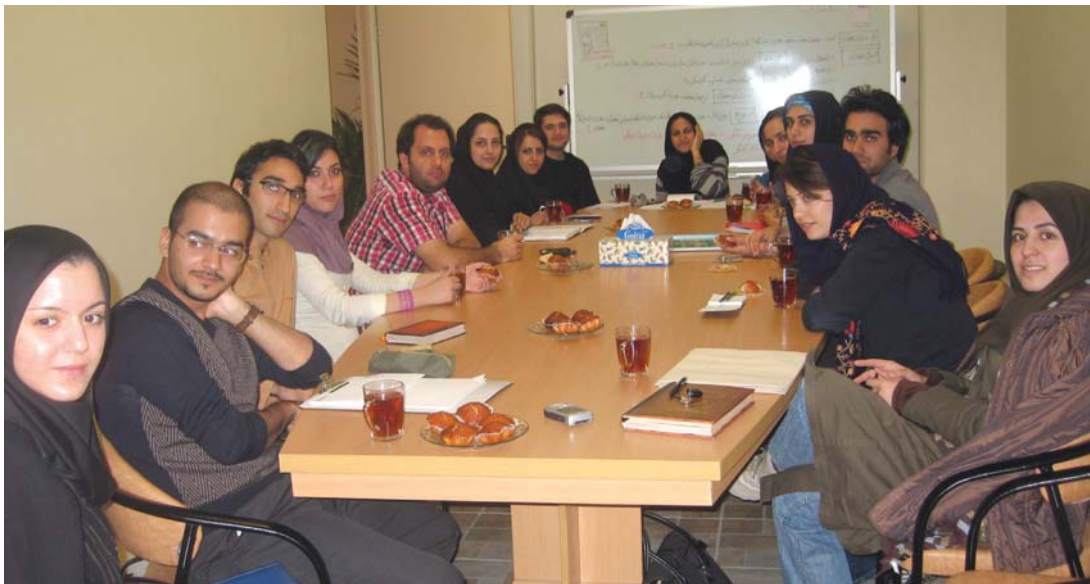
میزگرد انجمن معمار ۲۴ - / پژوهشکده نظر

مثلاً زها حدید هر پروژه و هر کاری که بهش بیدید اون مدلی که خودش بخواد را اونجا می‌گذاره. هر چی که خودش بگه، هر کاربری، توی هر