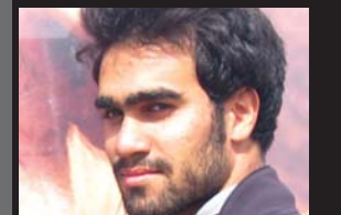
علی آشتیانی / دانشگاه شهید بهشتی