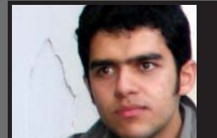
علی آشتیانی / دانشگاه شهید بهشتی