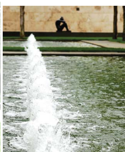
کاشت ردیفی درخت های بلوط و استخر آب در پس زمینه