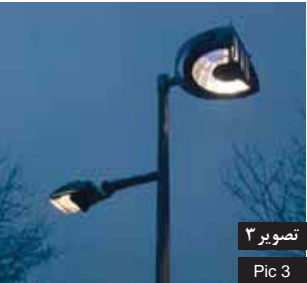
تصویر ۳ Pic 3

تصویر ۳: ایده نورپردازی شکسته که با ایجاد سایه روشن‌های جذاب محیط را پویا و شاداب می‌سازد، روتردام، هلند.