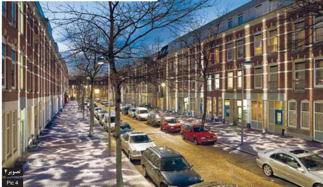
تصویر ۴ Pic 4

In fact, in the lighting of Atjeh street, art in the form of special lightings of floor and facades of the street is a factor in attracting people and shape their collective memories in the Ambiguity halo of dancing lights. Involving pedestrians feelings and a new visual experience for them in addition to changing the old street into a » pillar of light« in the context of the city, has blown rejuvenation in the empty spaces between the buildings.