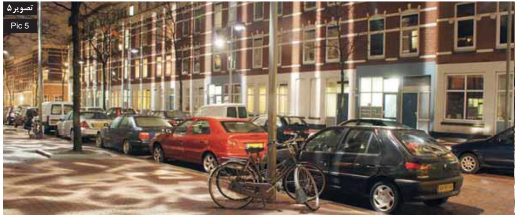
تصویر ۵ Pic 5

Keywords: Atjeh Street, Broken lighting, Urban lighting, Renovation, Identity.