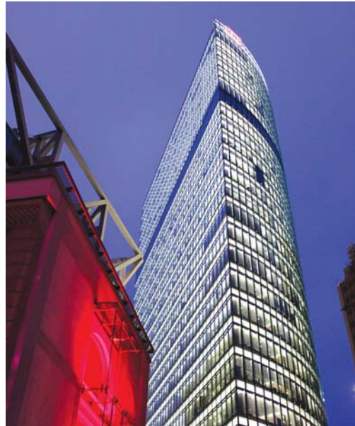
۳: بیرون‌زدگی‌های نوک‌تیز از مشخصه‌های معماری هلموت یان