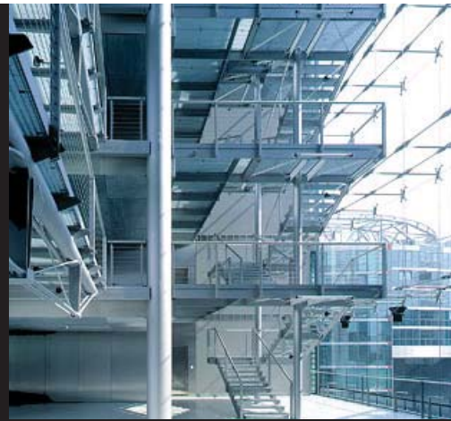
۶: شیشه به فضاها امکان می‌دهد به صورت لایه لایه درآیند