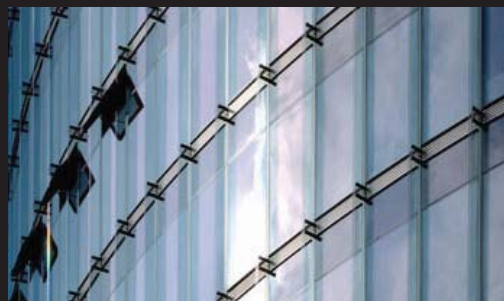
۷: کاربرد فراوان شیشه در معماری هلموت یان

نگاه «یان» همواره به جلو بوده، ولی همیشه چیزهایی را که در پروژه‌های گذشته آموخته، به یاد دارد و از آن‌ها استفاده می‌کند.