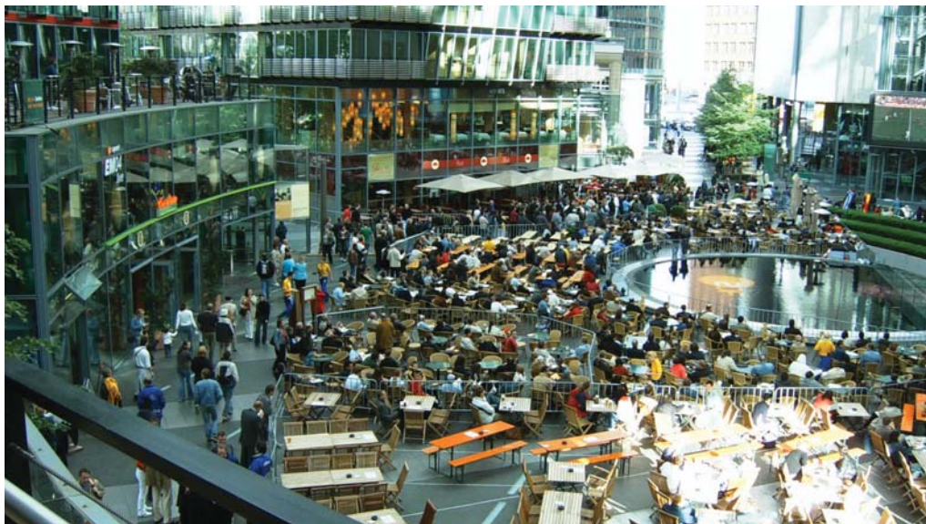
۲: فضای مرکزی مجموعه