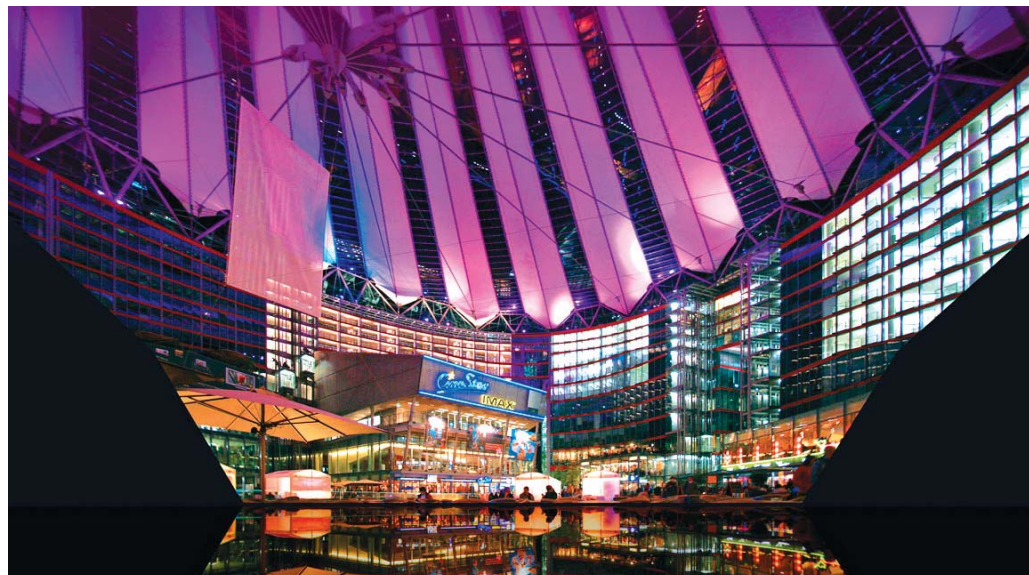
تصویر ۵: شکستن حالت کلیشه‌ای در ساختمان‌های اداری