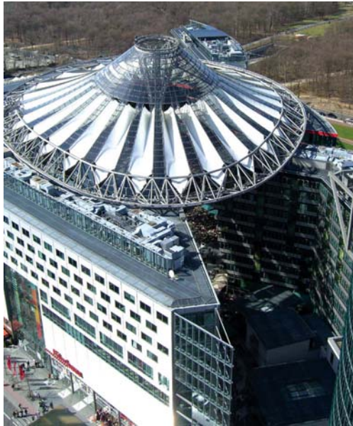
۴: سقف شیشه‌ای بر روی حیاط مرکزی