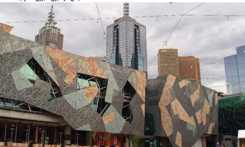
۵. میدان فدراسیون (ملبورن - استرالیا)