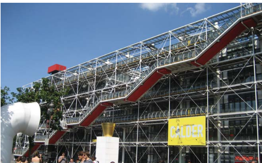
۴. ساختمان ژرژ پمپیدو (پاریس - فرانسه)