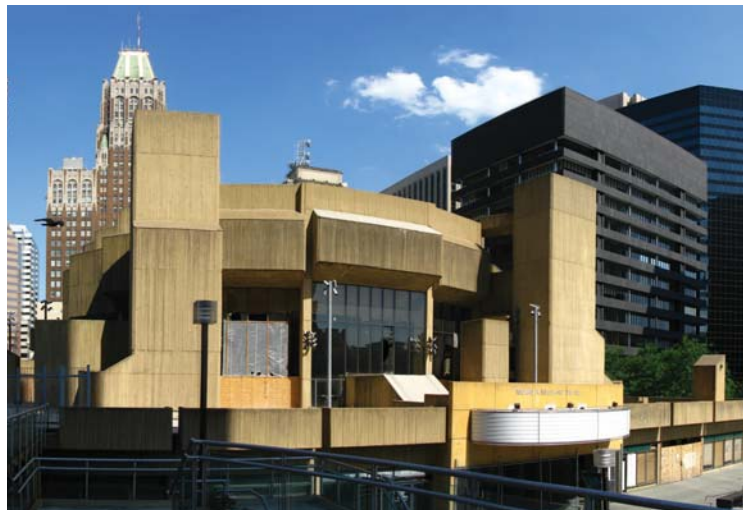
۱. ساختمان تاتار مورس ۱. مکانیک (بالتیمور - مریلند - آمریکا)

هر سال اعضا و نویسندگان «مؤسسه مجازی گردشگری» ساختمان‌های زشت جهان را معرفی می‌کنند. در سال ۲۰۰۸ این مؤسسه با انتشار فهرست ۱۰ ساختمان زشت جهان، بنای «Boston City Hall» را به عنوان زشت‌ترین ساختمان جهان معرفی کرد که مشکلات و انتقاداتی را برای آنان به همراه آورد. برای دومین بار نیز در پایان سال ۲۰۰۹ این مؤسسه فهرستی از ساختمان‌های زشت جهان را ارائه داده است. در فهرست امسال، ساختمان مشهور «ژرژ پمپیدو» اثر «رترزو پیانو» و «ریچارد راجرز» به عنوان چهارمین ساختمان زشت جهان معرفی شده است. شهرت این بنا و تمایل بسیاری از معماران حاکی از وجود شکاف میان سلیقه معماران و مردم است. این مؤسسه علی‌رغم گسترده بودن محدوده‌های مطالعه خود اذعان دارد که همچنان ساختمان‌هایی خارج از این محدوده وجود دارند. «Giampiero Ambrosi» مدیر مؤسسه مجازی گردشگری می‌گوید: "بسیاری از این ساختمان‌ها حتی به اندازه یک قالب یخ گرما ندارند، برخی از آن‌ها حتی کامل نیز به نظر نمی‌رسند".