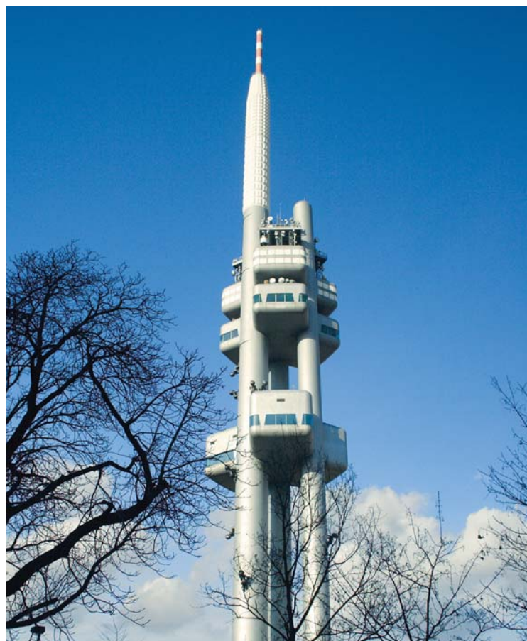
۲. برج تلویزیونی زیزکوف (پراگ - جمهوری چک)