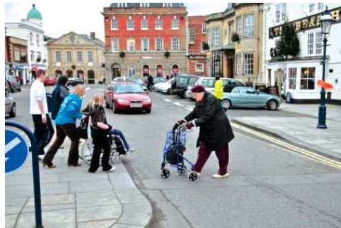
میدان بازار دیوایزس نتیجه‌ده سال کار اختصاصی طراحی با دقت است که در نگاه داشتن و بالا بردن سرزندگی شهر تاریخی ویلتشایر موفق عمل کرده است.

فواید مواد ساده و با دوام که در برابر فشار بارهای زیاد و فعالیت‌های پی‌درپی مقاومت در بیشتر موارد مطالعه شده، مشهود است. با این وجود همچنان مواردی با سطح کیفیت پایین و نگهداری روزانه نامناسب دیده می‌شود. نبود مهارت‌هایی که قطعیت آن‌ها در طول زمان ثابت شده باشد و نبود همکاری مناسب بین موسسات درگیر در نگهداری خیابان‌ها موجب نقصان آن‌ها در انگلستان شده است. در انگلستان تقریباً هیچ شرکتی مشابه strabenhauer و یا street builder که در تمامی امور مربوط به طراحی خیابان‌های موجود در کشورهای همچون دانمارک و آلمان و بسیاری دیگر از کشورهای اروپایی، مهارت داشته باشد، به وجود نیامده است. با این که مثال‌های زیادی از پروژه‌های موفق در بسیاری از نمونه‌های موردی وجود دارد، اما همچنان مهارت‌ها و تکنیک‌های زیادی برای دستیابی به استانداردهای موجود در کشورهای اروپایی لازم است.