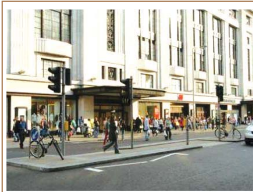
گذرگاه‌های شطرنجی خیابان کنسینگتون با برداشتن موانع و نرده‌ها دوباره طراحی شده است.

بخش مرکزی خیابان کنسینگتون شهر لندن به منظور پارک دوچرخه و پوشش گیاهی به اندازه ۳ متر تعریض شده است.