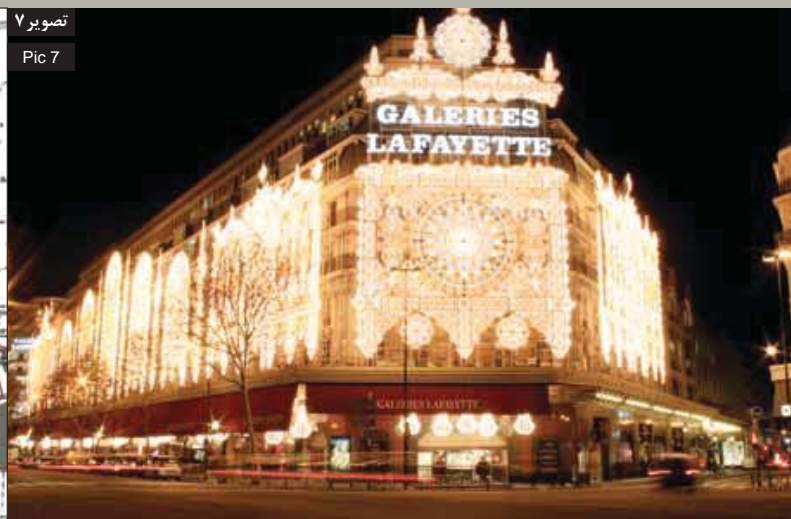
Pic 7: night view of commercial blocks along Haussman Boulevard: the ground floor façade includes transparent windows with no identity offering element and the upper parts of the façade are linear and also similar.

تصویر ۸: مناطق بیستگانه شهر مشخص شده‌اند. مناطق ۱ تا ۱۰ در اکثر سطح خود دارای معماری سنتی هستند و مناطق ۱۲ الی ۱۶ دارای منظر شهری کم و بیش مدرن و بین‌المللی‌اند. سایر بخش‌ها دارای معماری ویژه‌ای نبوده و ترکیب غیرمنظمی از اشکال مختلف‌اند. تحلیل تصویر از نگارنده.