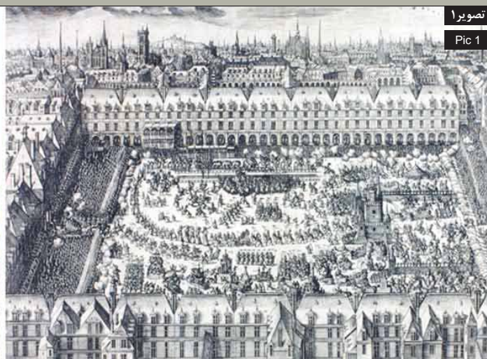
تصویر ۱ Pic 1