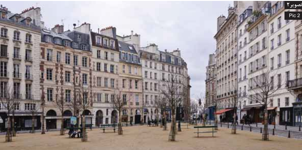
Pic2: The Dauphine square; the continuity of the similar facades on both sides of the street shows the act of higher preservation of historic facades in Paris. Although the street level had been transformed to commercials but it has not caused any damage to the holistic view of the façade in general.