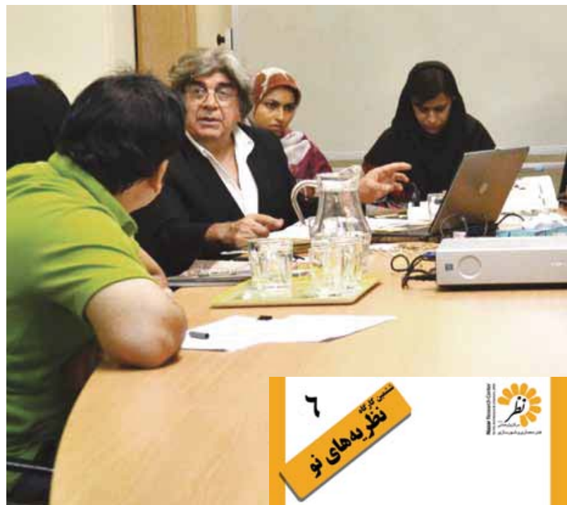
تصویر ۱ Pic 1

In general, everything is already written in Chinese gardens, but the Persian Garden is a white paper that you read it yourself. Eventually, we can conclude that Iranian garden has a hidden complexity while Chinese garden have an apparent complexity.