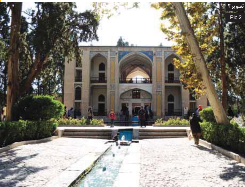
تصویر ۲ Pic 2