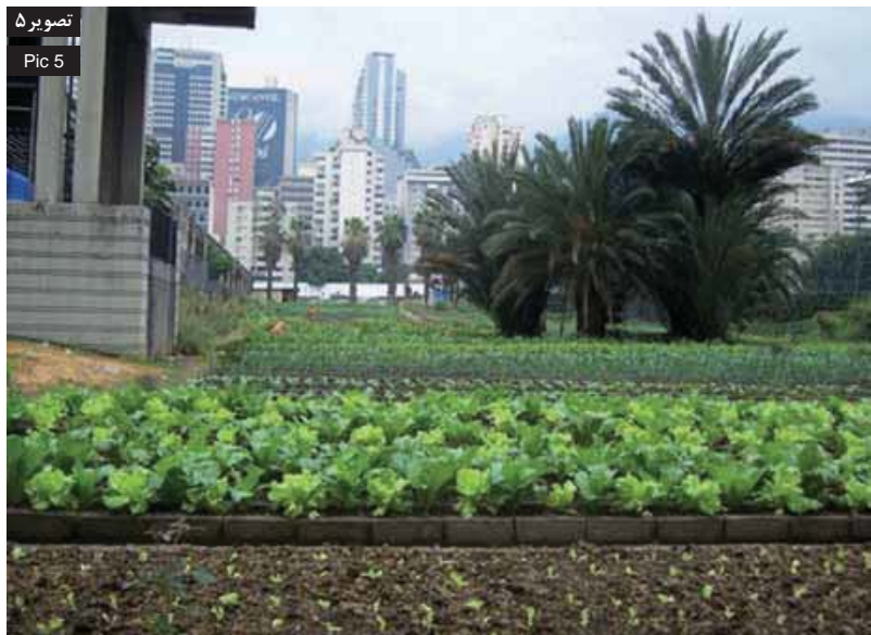
تصویر ۵: استفاده از مصالح و محصولات متفاوت در مزارع شهری به قسمتهای مختلف شهر شخصیت و ویژگی میبخشد.