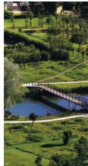
تصویر ۷: پیاده‌راه و پل