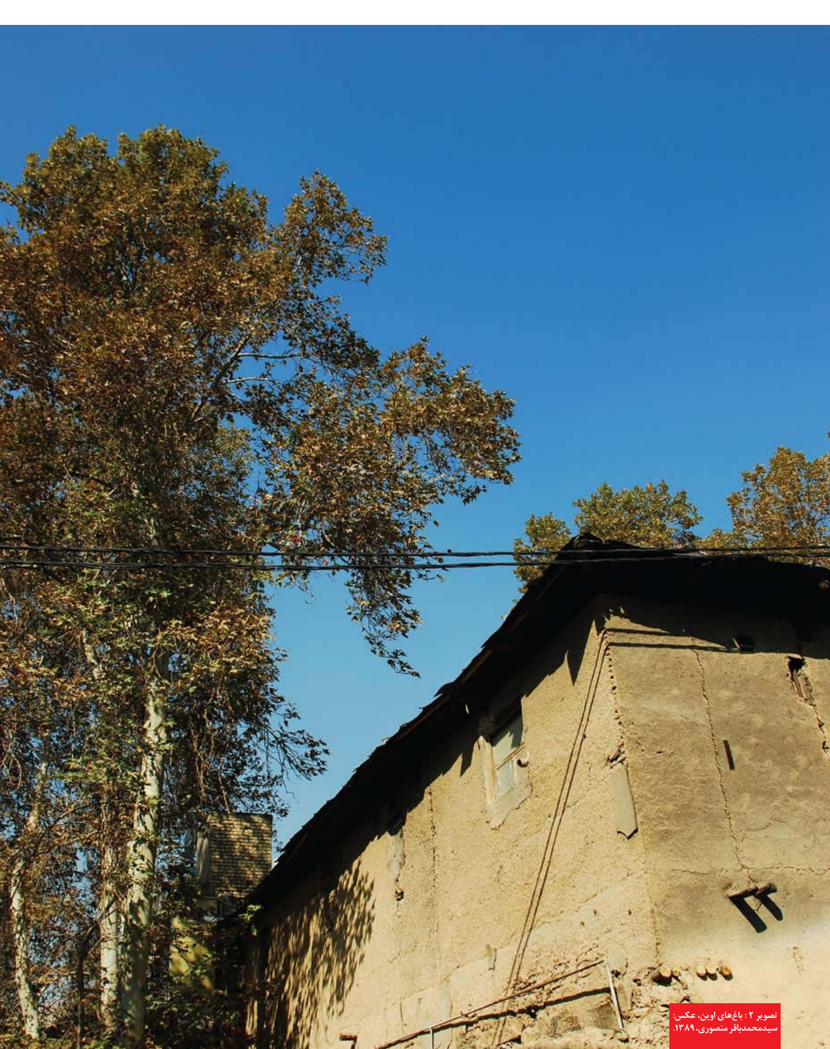
تصویر ۲: باغ‌های اوین، ۱۳۸۹.