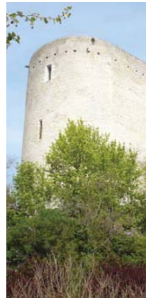
تصویر ۶: برج قدیمی شهر، مأخذ: (Desvigne&Dalnoky, 1995).