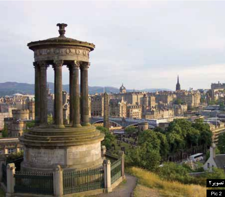
تصویر ۲ Pic 2

تصویر ۲: دورنمای دانشگاه لیورپول هوب، مأخذ: http://www.designstudier.no Pic2. Liverpool Hope University landscape, Source: http://www.designstudier.no .