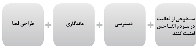
Chart 2: Environmental features to achieve safe and healthy environment

نمودار ۲: ویژگی های محیطی جهت دستیابی به محیط امن و سالم