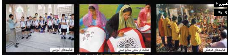
تصویر ۶ Pic 6