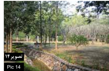
تصویر ۱۴ Pic 14