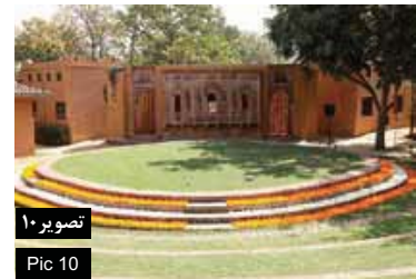
تصویر ۱۰ Pic 10