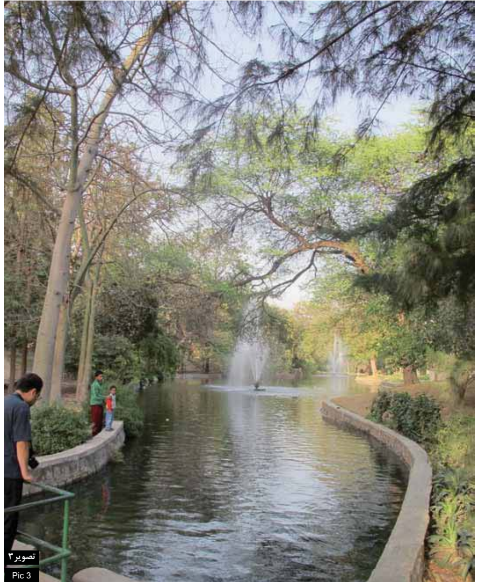
تصویر ۳ Pic 3

۲. در متون کهن هند، جریان جذب آب توسط زمین و تبخیر و بازگشت آن به طبیعت، نمادی از تولد، مرگ و باروری است. مسئله حفاظت از آب در طراحی این سایت از نگرانی‌های طرح اولیه بوده است. شیب سایت طوری طراحی شده است که آب یا جذب فضای سبز می‌شود یا وارد کانال آب. از طریق این پروژه طراح با آمیختن ویژگی‌های سنتی در فضای معاصر به