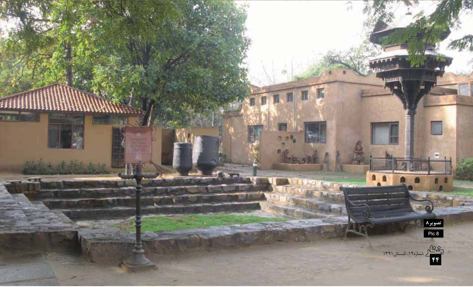
تصویر ۸ Pic 8