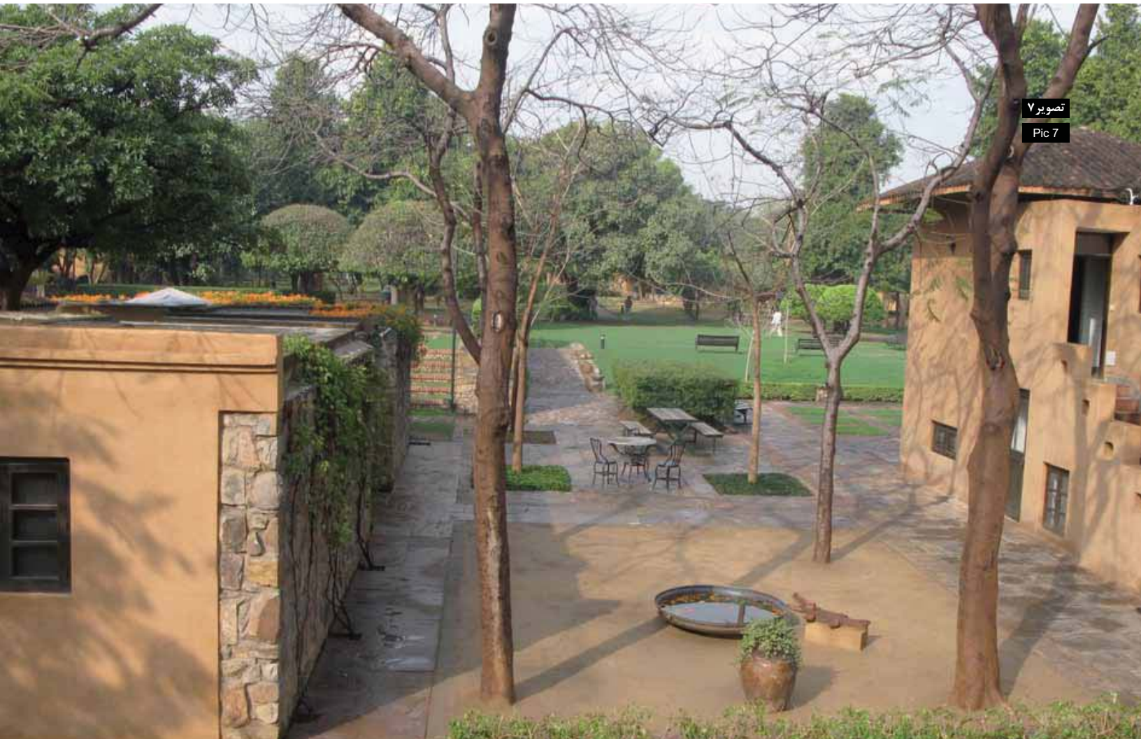
تصویر ۷ Pic 7