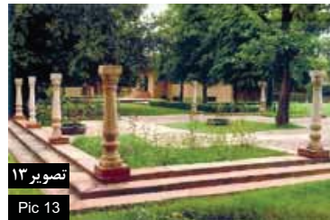
تصویر ۱۳ Pic 13