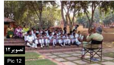
تصویر ۱۲ Pic 12