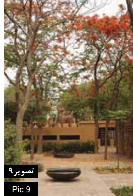
تصویر ۹ Pic 9