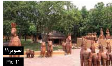
تصویر ۱۱ Pic 11