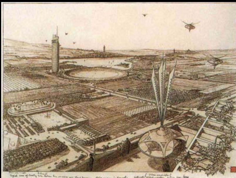
تصویر ۴: Broadacre City، پرسپکتیو از شهر زندگی، فرانک لوید رایت، ۱۹۵۸-۱۹۳۴.