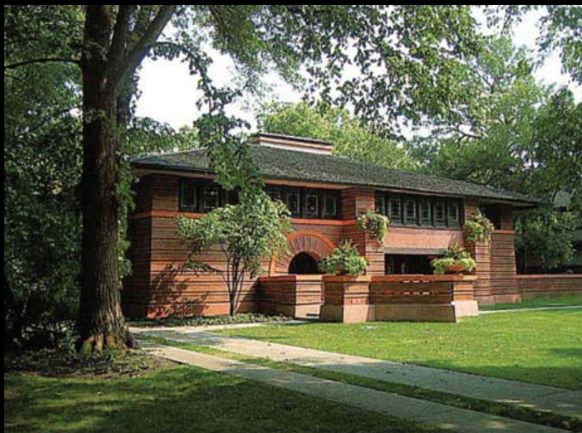
تصویر ۱: خانه Heurtley در Oak Park، فرانک لویدرایت، ۱۹۰۲.