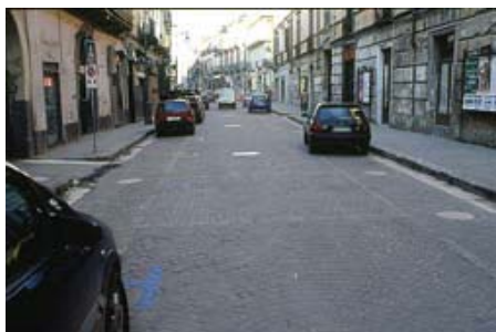
تصویر ۱۱: آورسا، خیابان اصلی شهر، نوسازی شده.