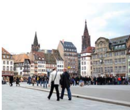
تصویر ۶: میدان کلیر، استراسبورگ. تراموا وارد شهر شده و با فضاهای پیاده و دوچرخه آمیخته می‌شود.