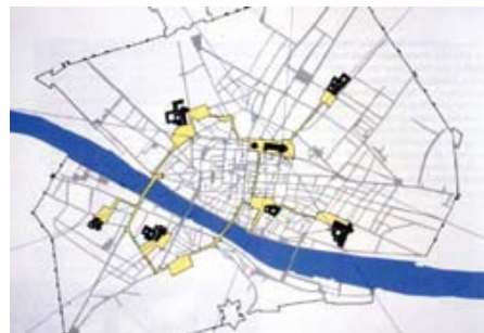
تصویر ۴: فلورانس عهد رنسانس، ادموندان بیکن.