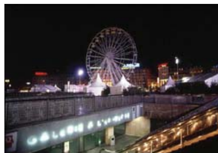
تصویر ۵: میدان راه آهن، استراسبورگ.