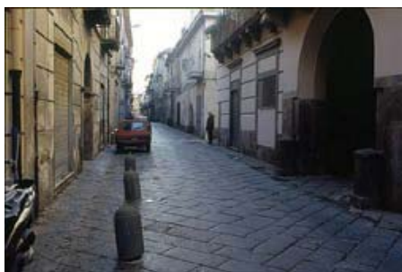
تصویر ۱۰: آورسا، خیابانی با کفسازی بازالت در مرکز تاریخی شهر.

بنابراین گاهی تفکر به جمله «آلفرد پیتر»، معمار منظر مفید است: «نور را بیش از حد نتابانید تا سنجاب‌ها بیدار نشوند!» (تصاویر ۱۰ و ۱۱) ■