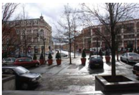
تصویر ۹: رویه، میدان جدید با ساختمان‌هایی که مرزها را محو می‌کنند.

فضای خصوصی و عمومی. گام دوم شامل خلق فضای جمعی در شکل‌های متنوع بود: خیابان، بولوار، میدان، زمین بازی. این روش، باعث اتصال پیاده نقاط مختلف شهر شد. مرحله سوم رسیدگی به طرح کاشت شهر بود. انتخاب و کاشت گونه‌های متنوع براساس ویژگی‌های هر فضای شهری. مرحله نهایی تخریب پارکینگ‌ها بود که زمین‌های تحت اشغال آنها به مجموعه‌ای جدید از برنامه‌های شهری اختصاص می‌یافت و در عین حال مشکل پارک اتومبیل‌ها در لبه بولوارها و خیابان‌های عریض حل می‌شد.