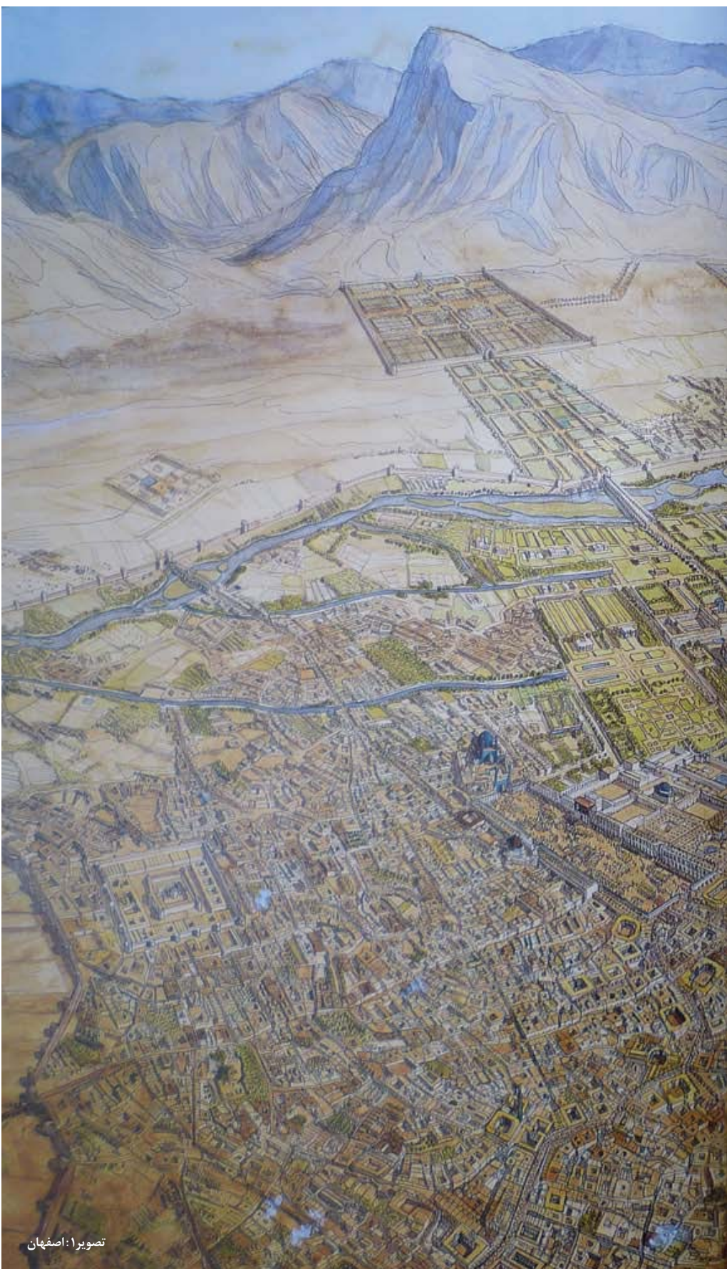
تصویر ۱: اصفهان

تمايز میان فضای خصوصی و عمومی در تمام شهرها مشاهده می‌شود؛ حتی اگر بعضاً مفهومی را که دربر می‌گیرد به تناسب فرهنگ‌ها متفاوت شود. آنچه که به شهر شکل می‌دهد در قدم اول بر خصوصیات جغرافیای آن و سپس،