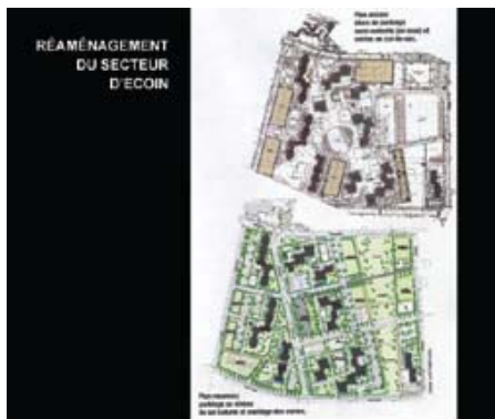
تصویر ۷: بازسازی یک مجتمع بزرگ مسکن‌های اجتماعی، دهه ۷۰ (۱۹۷۰)، و آن‌ون.