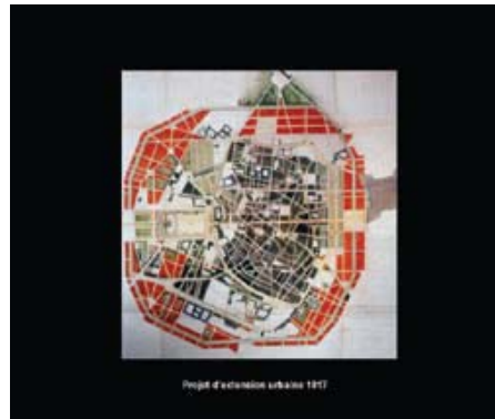
تصویر ۳: نقشه توسعه و مدرنیزاسیون شهر مَنپلیه، ۱۸۱۷.