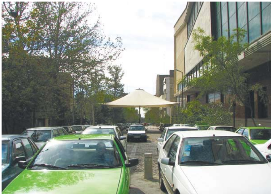
تصویر ۲: وضع موجود پیاده‌راه خیابان صبا در شهر تهران. عکس: رسول رفعت، ۱۳۸۹.

ادراک ما از شهرکه آن را منظر شهری می‌نامیم (منصوری، ۱۳۸۹: ۳۲-۳۴) به عوامل مختلفی وابسته است که پیاده‌راه در آن نقش مهمی ایفا می‌کند. می‌توان ادعا نمود اساساً درک ما از شهر، چیزی بر اساس فهم