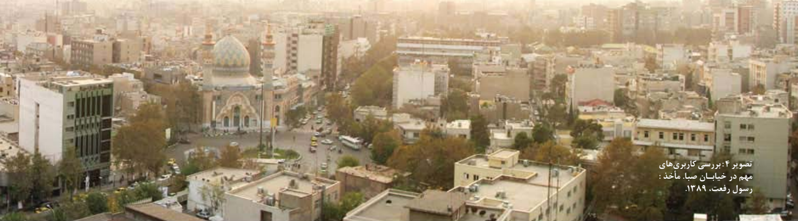
تصویر ۴: بررسی کاربری‌های مهم در خیابان صبا.