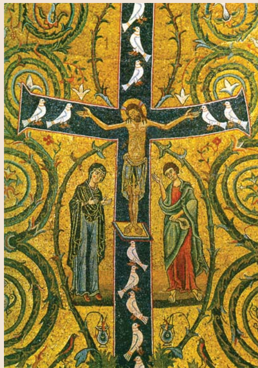
۲- درخت زندگی در قالب زندگی مسیح (ع)

در شمال نگاری مسیحی، صلیب عیسی (ع) نمودار درخت زندگی است که مسیح به منزله تنه درختی است که بر شاخه و برگهایش کبوتران سفید (پیک آشتی و رهایی)، دیده می شوند، (تصویر ۲)