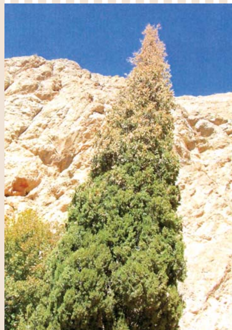
سرو کهن، زیارتگاه پیر سبز. یزد