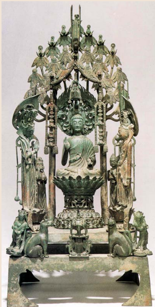
۱- بودا، درخت انجیر هندی

دانته، مجموع افلاک سپهر را چون قله یا تاج درختی تصویر می‌کند که ریشه هایش رو به سوی بالا دارند. ظهور خدا در درخت، مضمونی رایج در متون ودایی و هنر تجسمی شرق باستان است. در آثار هنری تمدن "مونهجودارو" ظهور خداوند در درخت "انجیر هندی"، در آثار هنری هند و بودایی تولد، تنویر و مرگ و رهایی خدایان و پیامبر در ارتباط با درخت مقدس است؛ (تصویر ۱)