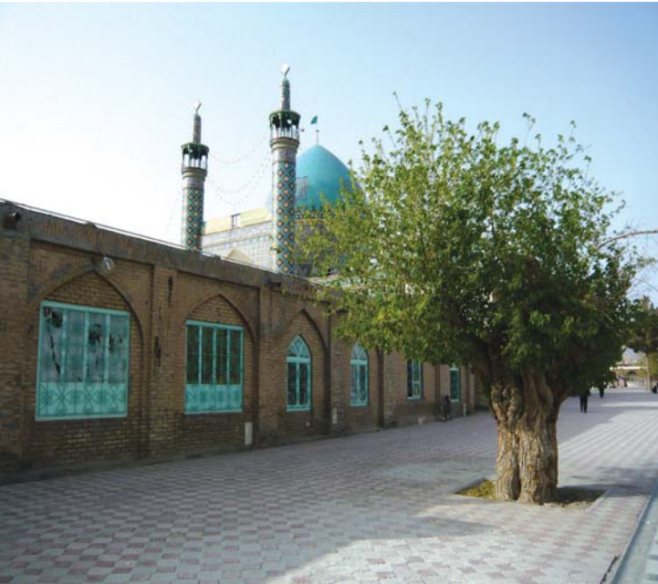
امامزاده حسین ابن موسی. طبس