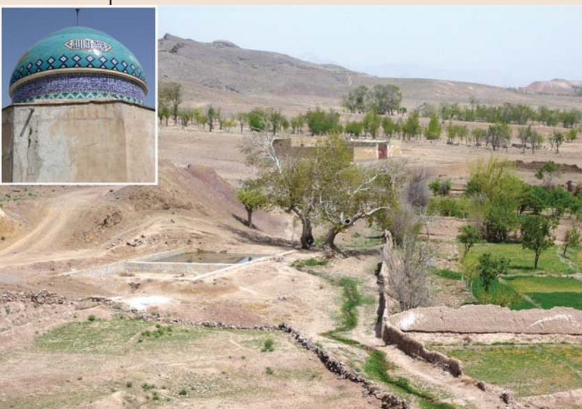
۴- پیر درختی، بقعه شیخ ابوالقاسم گورکانی. تربت حیدریه

نوشته حاضر در بخش درختان آیینی ایران، حاصل پژوهش های میدانی نگارنده است. مطالب مربوط به درختان مقدس در شرق و غرب جهان برگرفته از مطالعات تطبیقی "میرچالیاده" و بعضاً برداشت های میدانی نگارنده از سفرهایی به هند، چین، آفریقا و اروپا می باشد.