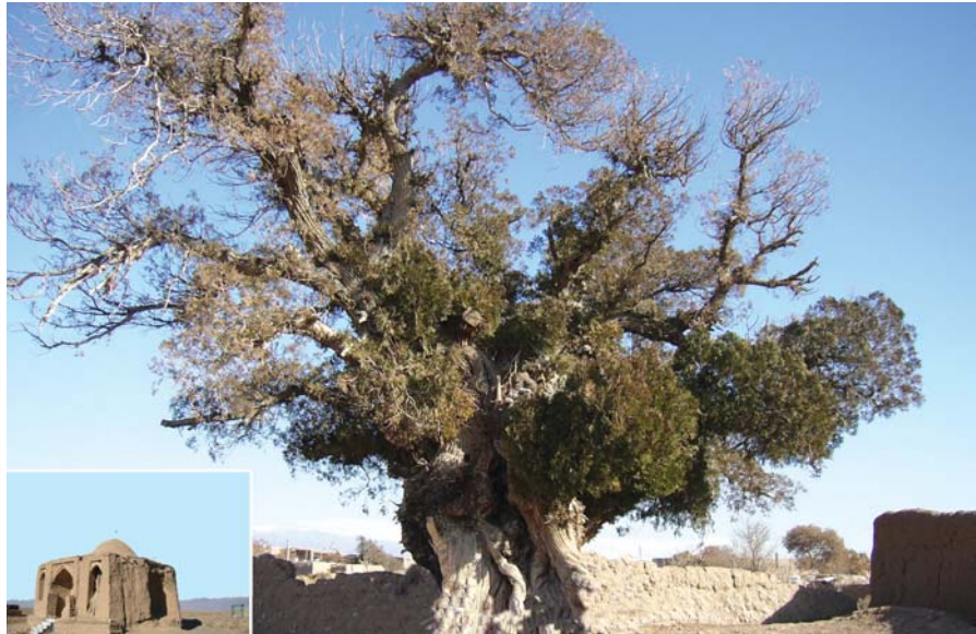
درخت سدر. امامزاده عبدالله. نیشابور. روستای جهان آباد