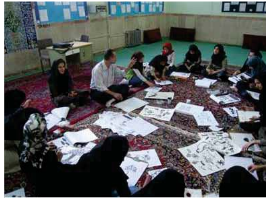
۲ و ۳: آموزش برای قشرهای مختلف محلی و همکاری آنها در مرحله مطالعات نوسازی، عکس: نگارنده.