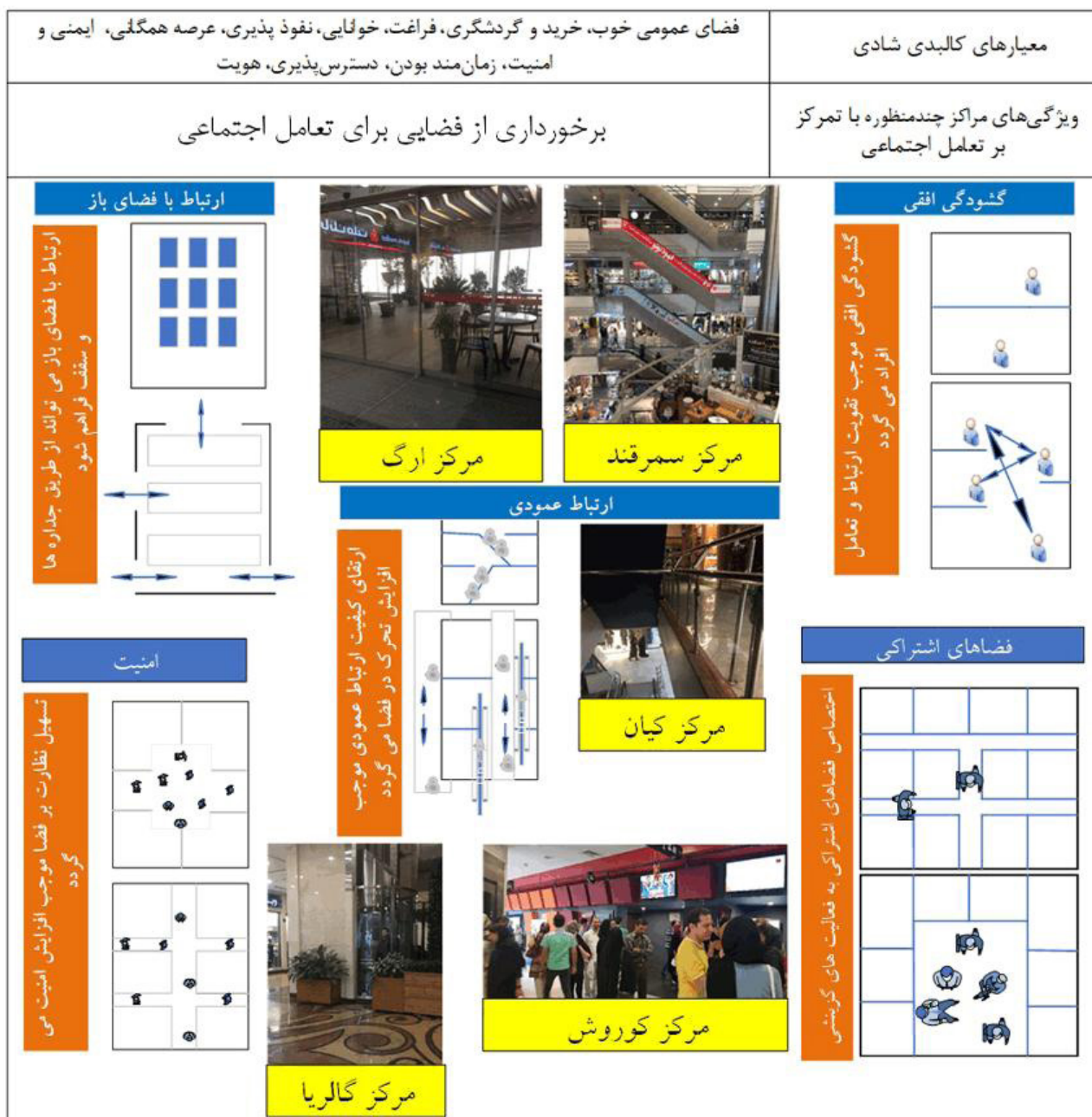
تصویر ۴. تطبیق معیارهای کالبدی شادی با ویژگی طراحی فضاهای تعامل در مراکز چندمنظوره شهری.

در قالب فودکورت‌ها امکان انتخاب بیشتری را برای افراد فراهم می‌آورد. پردیس‌های سینمایی فضا را برای گروه‌های مختلف دسترس‌پذیرتر می‌سازند. این امر می‌تواند موجب تنوع اجتماعی فضا شود. در فضای چندمنظوره پیوستگی و همزمانی فضای بازی کودکان با فعالیتهای بزرگسالان موجب شادی و تعامل فضا می‌شود. انواع مختلف فروشگاه‌ها مانند سوپرمارکت، کتابفروشی، اسباب‌بازی‌فروشی، داروخانه و ... در فضاهای چندمنظوره، به‌ویژه در زمان حاضر که بسیاری از افراد به دلیل شرایط زندگی در شهرهای