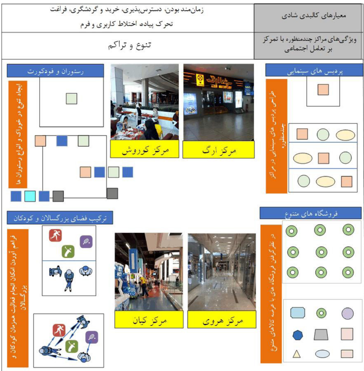
تصویر ۳. تطبیق معیارهای کالبدی شادی با ویژگی تنوع و تراکم در مراکز چندمنظوره شهری. مأخذ: نگارندگان.

خصوص مراکز چندمنظوره شهری اشاره شد، این مراکز دارای طیف متنوعی از کاربری‌های فرهنگی، تجاری، تفریحی، اجتماعی و ... در یک مجموعه عمودی هستند. طراحی ویژه این مراکز بر خلاف نسل‌های گذشته مراکز خرید در تهران، امکان انجام فعالیت‌های گزینشی را برای مخاطبان فراهم آورده است. تنوع و تراکم، امکان انجام فعالیت‌های همزمان را به‌ویژه برای زنان که از مخاطبان اصلی فضاهای چندمنظوره محسوب می‌شوند، فراهم آورده است. همانطور که در تصویر ۳ نشان داده شده است، تنوع و تراکم، موجب افزایش دسترس‌پذیری فضا می‌شود، که امکان