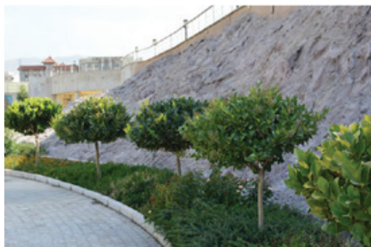
تصویر ۱ Pic1

Keywords | Museum, Exhibitive landscape, Place Attachment, Persian garden.