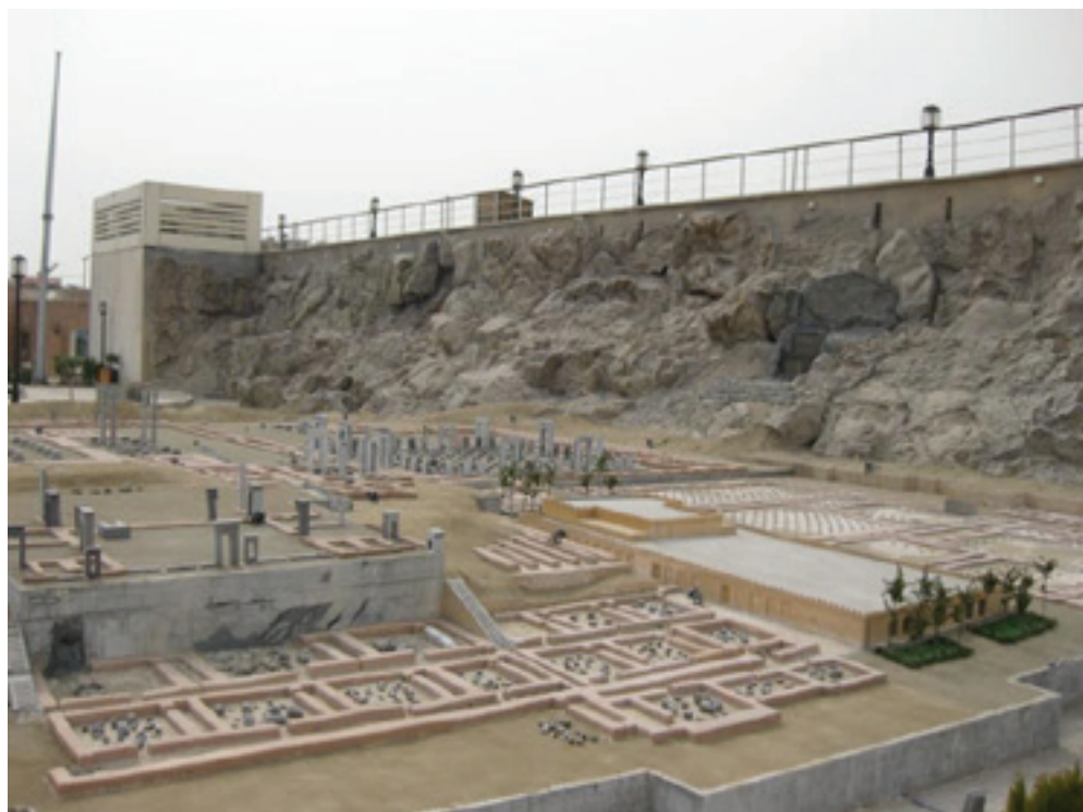
تصویر ۵ Pic5