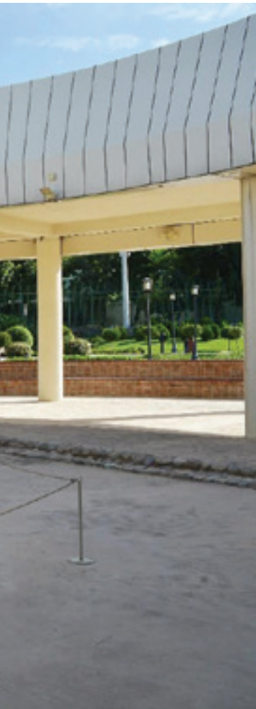
تصویر ۴ Pic4

تصویر ۴: وجود فضاهای مکث در کنار آثار از ویژگی‌های منظر نمایشگاهی می‌باشد که به ندرت با استفاده از مسیرهای مسقف و نقاط سایه‌دار حاصل شده است.