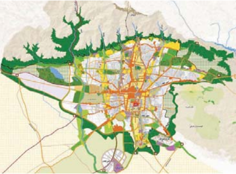
تصویر ۲: نقشه ساختار فضایی شهر تهران مصوب ۱۳۸۵ شورای عالی شهرسازی