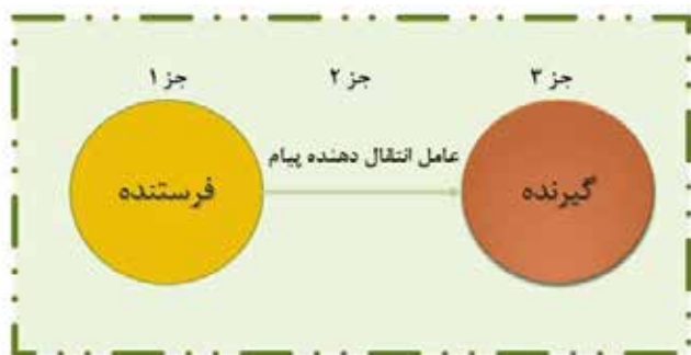
تصویر ۱. مدل مفهومی فضای رسانه‌ای براساس سیر آرای نویسندگان در حوزه رسانه.

از قرن هفدهم تا کنون دو زمینه معنایی برای رسانه سراغ داریم: اولین معنا این است که رسانه مدیوم است، یعنی واسطه بین دو چیز است. رسانه در معنای دوم، که از معنای اول ناشی می‌شود و بعداً از آن جدا شده است، پدیده‌ای است که در رسیدن هدف به کمکمان می‌آید (Sandboth, 2005, 3). یعنی رسانه وسیله‌ای است که فرستنده به کمک آن معنا و مفهوم مورد نظر خود، یعنی پیام، را به گیرنده منتقل می‌کند. هر دو معنا در مورد رسانه‌های جدید صادق است: از یک‌سو، رسانه‌ها ابزار ارتباطی هستند. ارتباط جمعی به خودی خود صورت نمی‌گیرد، بلکه به ابزاری نیاز دارد که از طریق آن بتوان با جمع کثیری ارتباط برقرار کرد و این ابزار همان رسانه است. از سوی دیگر، رسانه‌ها واسطه اطلاعات هستند (دیباچی و