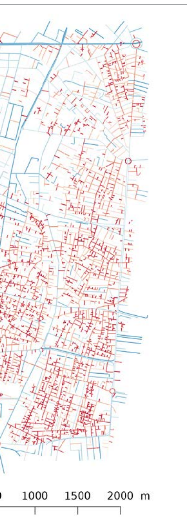
تصویر ۴: شاخص فاصله اعمال شده بر منطقه مرکزی شهر تهران.

pic4: Indicator spacing applied to a sample of Tehran streets network.