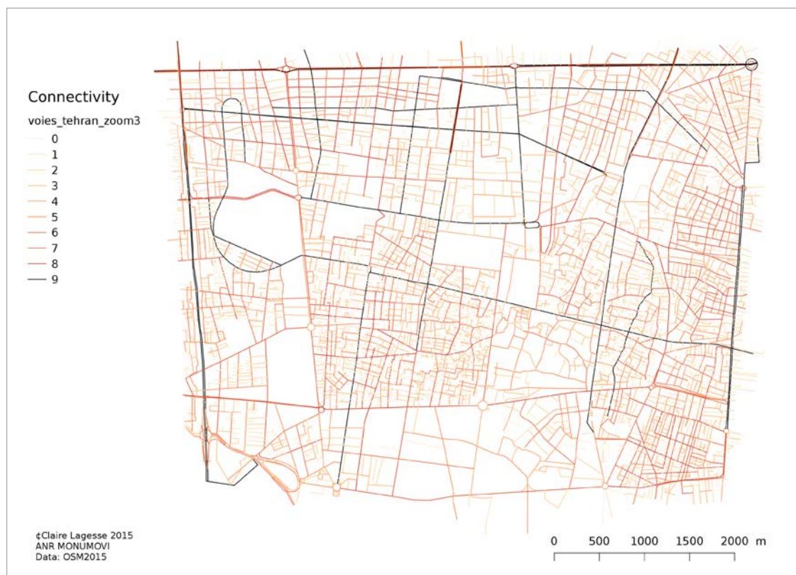
تصویر ۲ Pic2

تصویر ۲: شاخص اتصال در نقشه محدوده مرکزی تهران. رنگ‌های تیره‌تر اتصال‌های مهم‌تر را نشان می‌دهند. راه‌های اصلی تردد هم در پس‌زمینه ساختاری پنهان است.