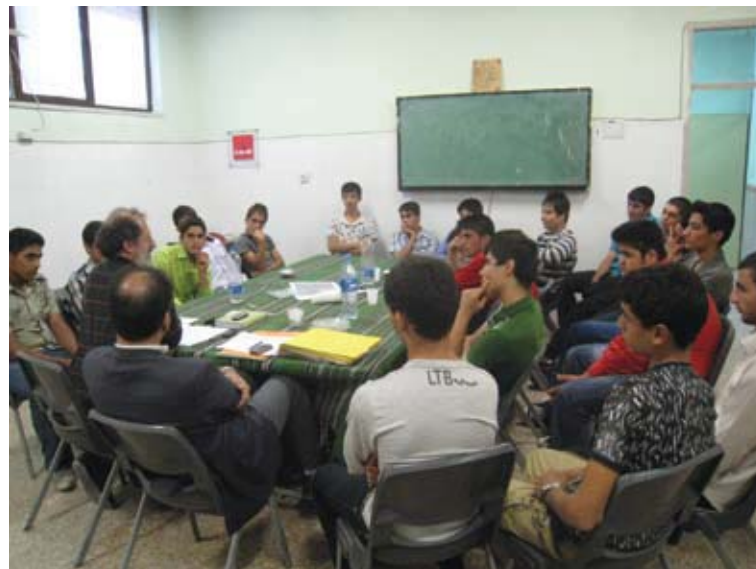
تصویر ۳ : کلاسهای هنر مهندسی. عکس : نگارندگان، ۱۳۸۹.