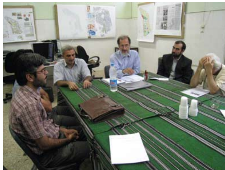
تصویر ۴ : جلسه مدیریتی با اوقاف. عکس : نگارندگان، ۱۳۸۹.