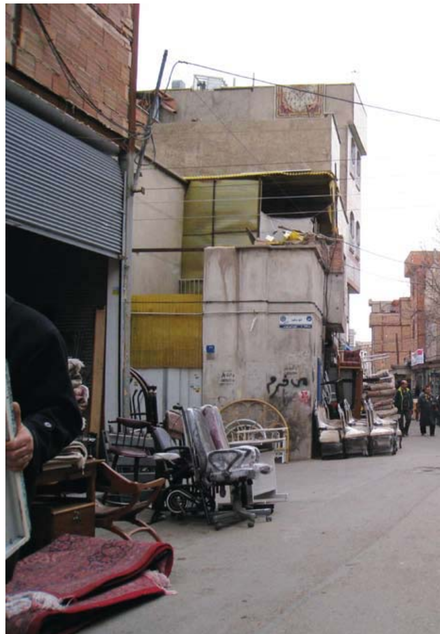
تصویر ۱: کارگاههای تولید مبلمان. عکس: نگارندگان، ۱۳۸۹.

Key Words: urban decay renewal, renewal office, Nemat Abad sector, Participation, Citizen, Tehran