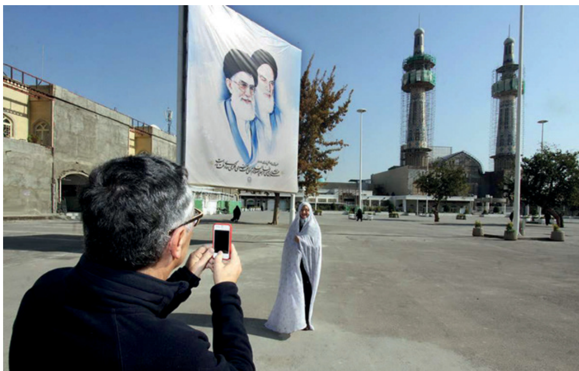
تصویر ۲ Pic2