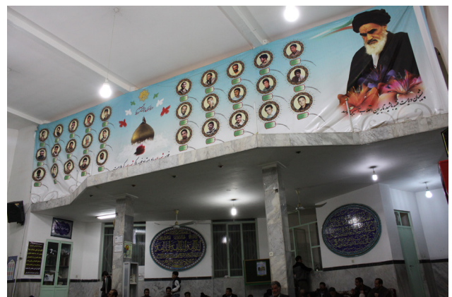
تصویر ۲: نمایی از داخل مسجد محل، عکس سی شهید به همراه امام خمینی (ره) و گنبد حرم امام حسین (ع).