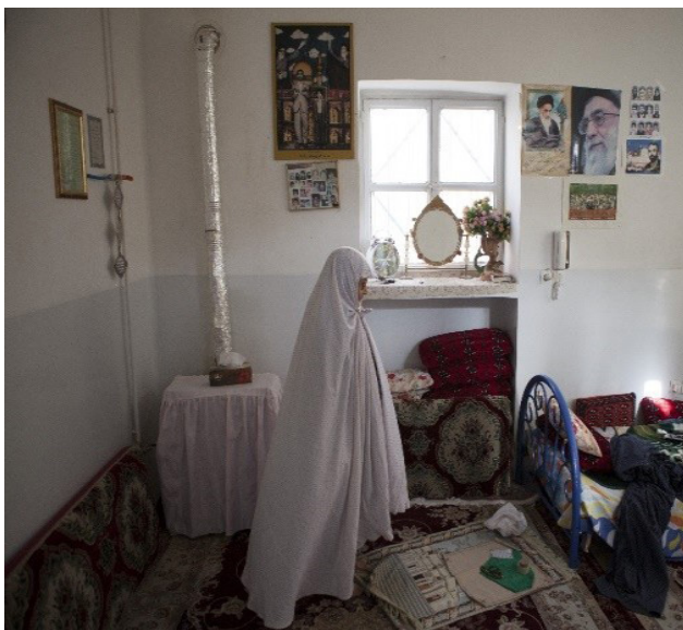
تصویر ۸: جای‌گذاری تصاویر در فضای خصوصی خانه شهدا. عکس: سید سعید رضا رضوی، ۱۳۹۶.