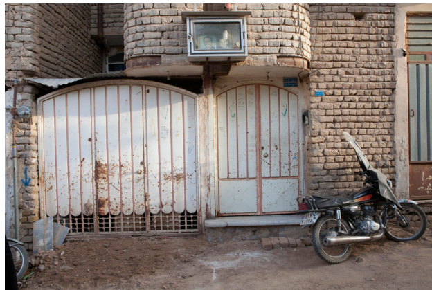
تصویر ۴: کاربرد عکس در سردر خانه‌های محله شهدای کاشان.

وجود مبارک شهید، تزئین این تصاویر شده است. می‌توان بیان کرد که بهره‌گیری از تصاویر شهدا به ویژه در فضاهای عمومی شهری علاوه بر فراهم آوردن زمینه برای شناخت و یادآوری فداکاری‌های شهیدان، راهکاری برای مقابله با تهاجم فرهنگی و بحران جوانان نیز به شمار می‌آید. این راهکار مورد تأیید طبقه متوسط، دولت و طبقه کارگر است، زیرا ارزش‌های نسل قبل را با سادگی به نسل جدید به وسیله بیان تصویری آموزش می‌دهد. حضور این تصاویر در زندگی شهری هم‌نشینی مسالمت‌آمیزی میان ارزش‌های شهیدان و زندگی روزمره افراد پدید آورده و زمینه را برای تجربه خاطرات شهیدان و رشادت‌های آنها در مکان و زمانی متفاوت فراهم می‌کند.