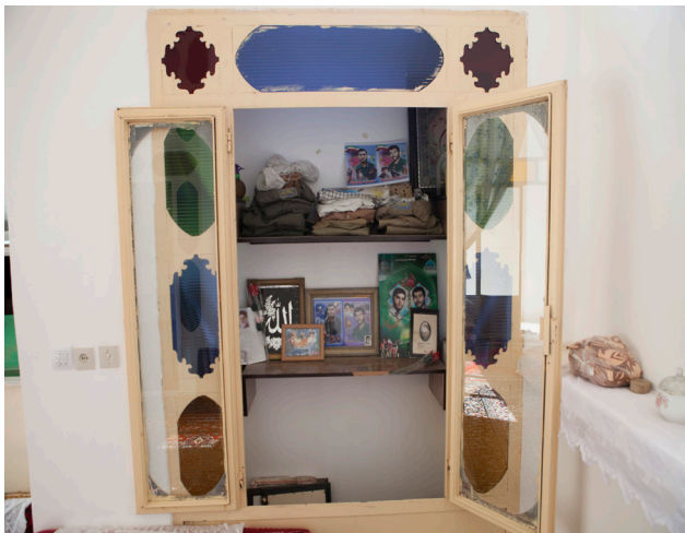
تصویر ۷: موزه‌های کوچک از وسایل دو شهید در گوشه‌ای از خانه. عکس: سید سعید رضا رضوی، ۱۳۹۶.