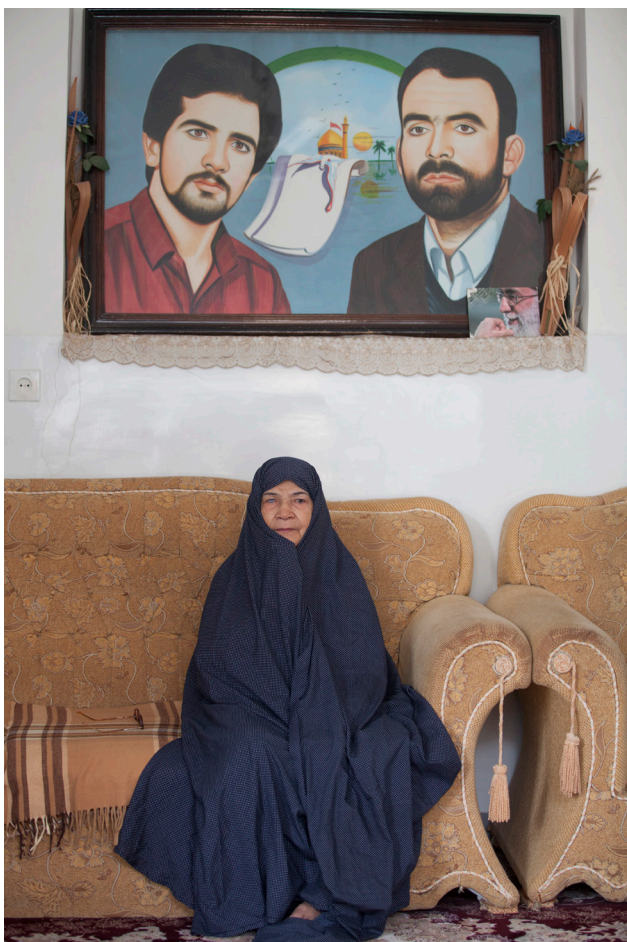
تصویر ۶: فضای رسمی خانه و تزئین فضا با عکس‌های رسمی. عکس: سعید رضا رضوی، ۱۳۹۶.