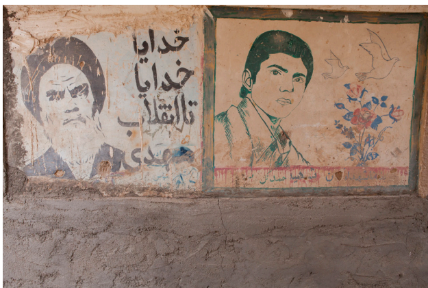
تصویر ۳: دیوارنگاره‌ای قدیمی در محله شهیدای کاشان.

به امری ذهنی تبدیل نشود. در مسجد محل می‌توان عکس‌های شهید را بر روی یک بنر در کنار تصویری بزرگ‌تر از امام خمینی (ره) مشاهده کرد (تصویر ۲). کوچه و خیابان: در کوچه و خیابان نقاشی‌های دیواری قدیمی شهید و امام خمینی مشاهده می‌شود. تصویر شهید و امام خمینی (ره) در یک قاب، بر آرمان باشکوه شهید صحنه می‌گذارد و نمادی برای گذشت و ایشار و اجابت دستور و فرمان ولی خدا می‌شود. تصویر ۳، نشان‌دهنده دیوارنگاره‌ای قدیمی در کوی شهید است. سردر خانه‌ها: عکس‌هایی نیز از شهید در قاب‌های فلزی در سردر بعضی خانه‌ها قرار دارد (تصویر ۴). این