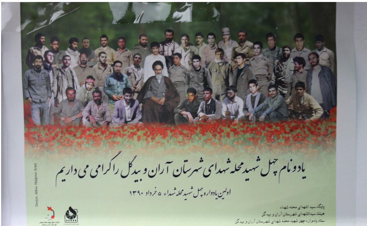
تصویر ۱۰: عکس دسته‌جمعی شهدا با امام خمینی.

عکس‌های باز تولیدشده از عکس‌های قدیمی: شامل عکس‌هایی است که توسط نرم‌افزارهای ویرایش عکس (همچون برنامه فتوشاپ) بازسازی شده‌اند و رنگ‌های شفاف و پرکنتراست دارند. این عکس‌ها توسط جوانان محل و آشنای کمی که به ابزار جدید دارند، برای خوشحال کردن خانواده شهدا و مراسم‌هایی که به یاد شهدا برگزار می‌شود، ساخته می‌شوند. آنها برای بعضی از عکس‌ها کادریایی طراحی می‌کنند تا مشخص شود عکس متعلق به یک یا چند شهید است. این بازسازی می‌تواند