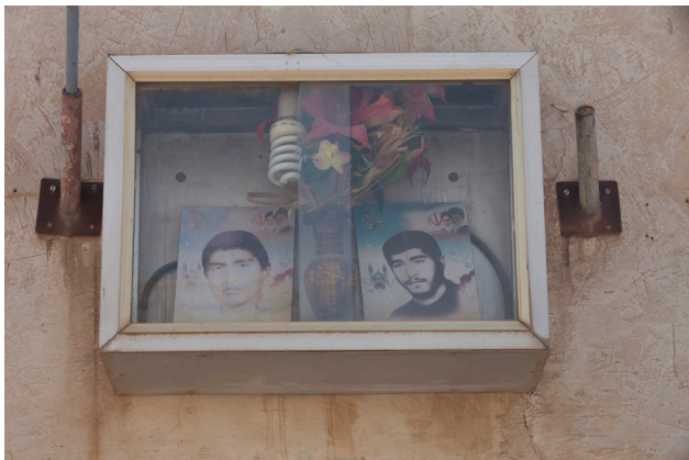
تصویر ۵: وجود گل و گلدان در کنار عکس‌ها. عکس: سعید سعید رضا رضوی، ۱۳۹۶.

خاص استفاده می‌شوند اما در دیگر مواقع سال، درب این فضا بسته است. بعضی از رزمندگان و خانواده شهدا در یک قسمت از خانه، یادگارهای شهید را به سلیقه شخصی خود چیده‌اند (تصویر ۷).