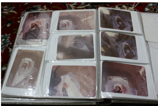
تصویر ۹: صفحاتی از یک آلبوم که مربوط به خاک‌سپاری شهید است.

در فضاهایی از خانه قرار می‌گیرند که مورد استفاده روزانه اهل خانه است (تصویر ۸). بعضی از این عکس‌ها، عکس‌های غیررسمی خود رزمندگان، برخی عکس‌های گروهی و برخی دیگر عکس‌های تکی است. البته زمانی که فضای خانه محدود است، این تقسیم‌بندی فضاهای خانه به دو قسمت امکان‌پذیر نخواهد بود و عکس‌ها در تنها اتاق خانه قرار می‌گیرند.