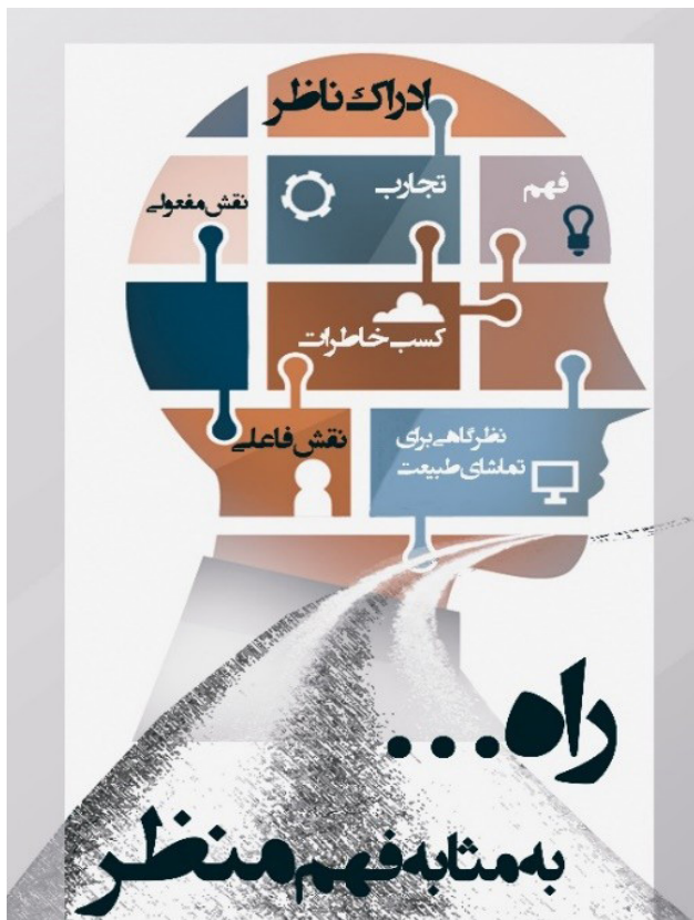
تصویر ۱: راه به مثابه فهم منظر.

زندگی شهری در طول تاریخ همواره با تعامل سازنده میان مخاطبان تعریف می‌شود و روابط شهروندان با یکدیگر باعث ارتقای زندگی جمعی در شهر بوده است. زندگی پیاده بستری مناسب برای ایجاد این تعاملات فراهم می‌آورد. در این میان پیاده‌راه به دلیل ویژگی ذاتی خود در ایجاد تعاملات اجتماعی از نقش اساسی برخوردار است. مدنی‌پور یکی از ویژگی‌های شهر خوب را شهر قدم زدن و مکث کردن می‌داند، شهری که فضای شایسته، منسجم و به دور از ازدحام برای قدم زدن دارد (مدنی‌پور، ۱۳۹۱). برقراری تعاملات اجتماعی از مهم‌ترین شاخص‌های فضاهای جمعی، امری است که به واسطه همین پیاده‌روها امکان‌پذیر است. احداث پیاده‌راه‌ها می‌تواند در ثبت و ارتقای حیات مدنی مراکز شهر مؤثر باشد. طبق نظر «کریستوفر الکساندر»، خیابان‌های شهر صحنه‌ی رویارویی اجتماعی است، خیابان زمینه‌ی تعامل میان گروه‌های مختلف را فراهم می‌آورد که این خود باعث نظم اجتماعی