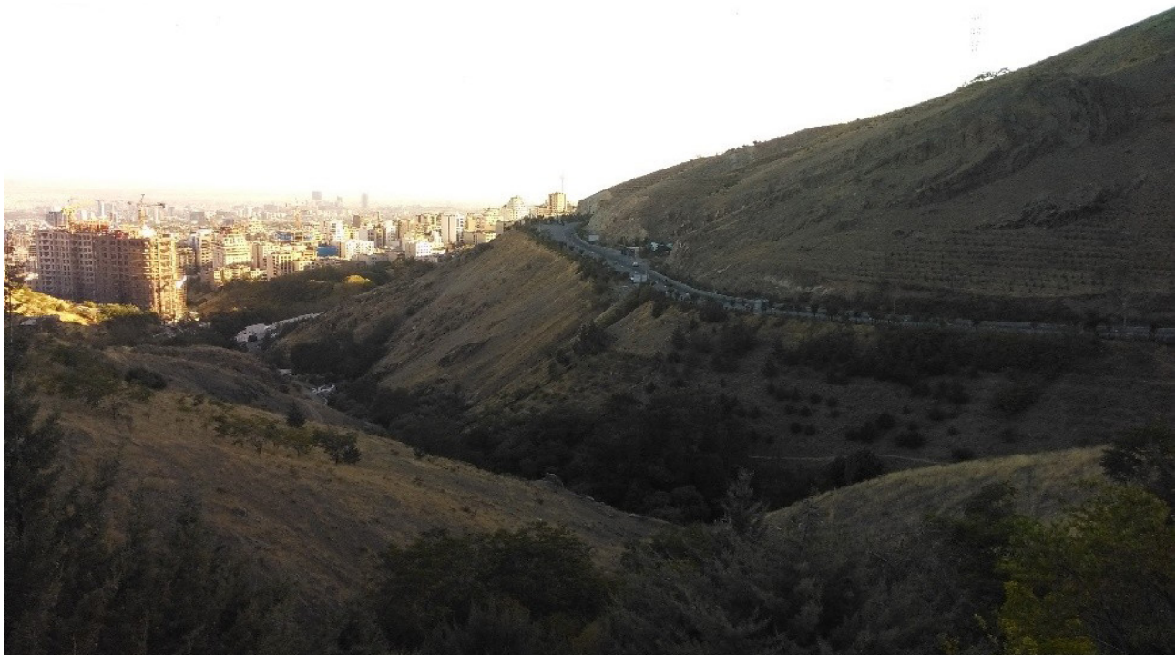
تصویر ۳: پیوستگی منظر طبیعی بام تهران و شهر تهران. عکس: فرزنان حاجی رضایی، ۱۳۹۷.

گردشگری و تفریح در واقع جوابی است به نیازهای درونی انسان که زمینه ارتقاء فکری، انبساط خاطر و تخلیه روحی و روانی او را فراهم می‌کند. همان‌گونه که انسان به پرورش جسم نیازمند است، به تفریح سالم نیازمند است تا بدین شکل بتواند به آرامش روحی و فکری برسد (غضنفری و جوادی، ۱۳۸۸). امروزه با توجه به هدف و انگیزه سفر، طیف وسیعی از گردشگری همچون: گردشگری تاریخی، طبیعی، زیارتی، آیینی و... شکل گرفته‌است. در این بین مسیر کوهستانی بام تهران در دامنه رشته کوه‌های البرز به عنوان لبه منظرین تهران از اهمیت بالایی برخوردار است. در این مسیر پیاده غالب فعالیت‌ها معطوف به معرفی مکان‌های طبیعی بکر و دست‌نخورده و ارائه برنامه‌های گردشگری