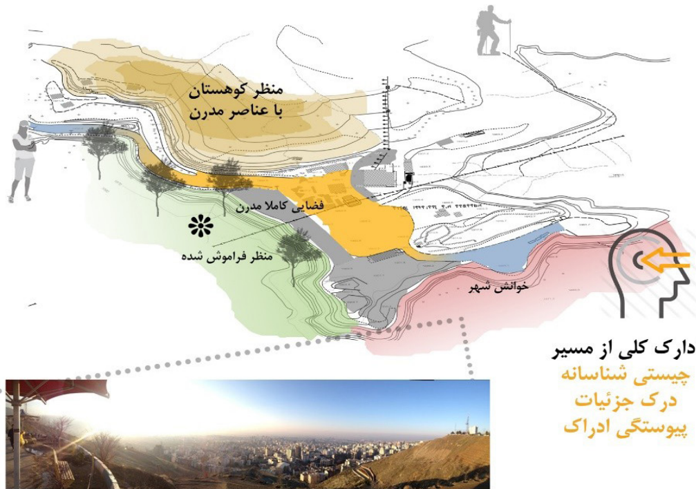
تصویر ۶: ادراک در مرحله سه، ادراک کل نگر نسبت به مسیر.

مسیر، این سکانس‌های بصری و متوالی به صورت یک کل منسجم ادراک می‌شود. این پیاده راه طبیعی-اجتماعی با عملکرد منحصر به فرد در کنار شهر به نوعی باعث شده که حس مکان‌ها و نمادهای طبیعی در منظر کوهستان قابل درک‌تر شود. این راه همچون سناریویی است که به کاراکترهای آن نقش و معنی داده و در نهایت باعث پیوستگی بین ادراک مخاطب از شهر تهران و طبیعت کوهستان توچال شده‌است (تصویر ۷).