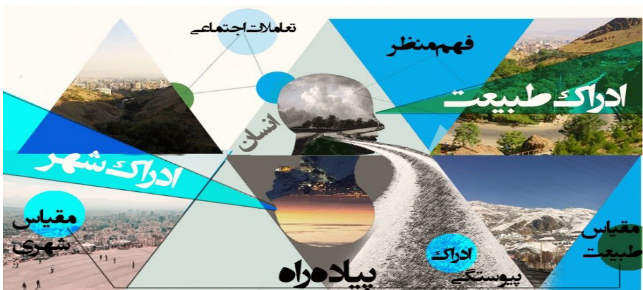
تصویر ۷: روند ادراک منظر پیاده‌راه بام تهران در ذهن انسان و شکل‌گیری کاراکتر فضا.

اجتماعی ناشی از تعاملات اجتماعی در فضای جمعی آن منجر به شکل‌گیری یک کاراکتر طبیعی-اجتماعی شده‌است. این هویت التقاطی در مسیر انتهایی بام تهران (تراس) یک فضای جمعی را با بالاترین تعاملات اجتماعی در کنار بالاترین تعاملات طبیعت‌گرایانه (فاعلی-مفعولی) شکل داده است. در این فضا تفسیری مدرن از شهر تهران بر یک بستر طبیعی رخ می‌دهد و شناخت منظر پیاده‌راه از طریق هویت‌ها و نمادهای آن صورت می‌گیرد. در واقع پیاده‌راه بام تهران همچون یک عامل پیوند دهنده عمل کرده و با حرکت انسان در این