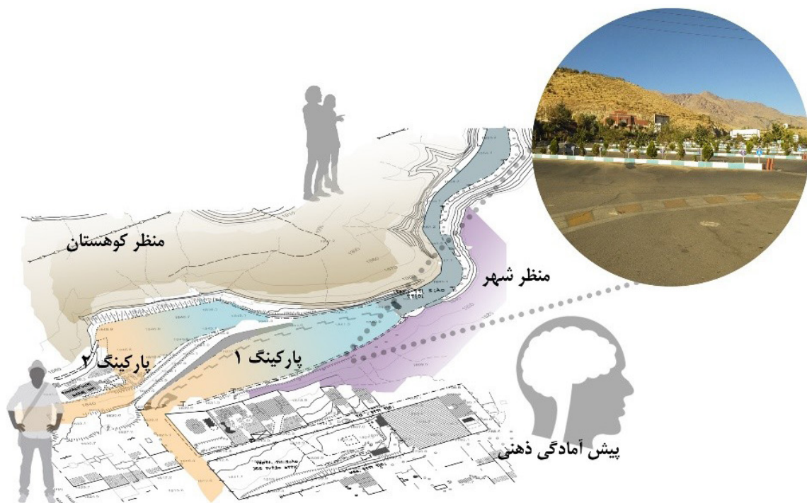
تصویر ۴: ادراک در مرحله یک، پیش‌آمادگی ذهنی.

در انتهای خیابان ولنجک مسیر پیاده بام تهران از پارکینگ شروع می‌شود. مخاطب در این مسیر از ورودی تا ابتدای پیاده‌راه سلامت به یک ادراک کلی از فضای بین شهر و طبیعت می‌رسد. این فضا همچون فضایی میان‌دار و مرز بین شهر و طبیعت است. مخاطب به تدریج از شهر دور شده و پا به عرصه طبیعت می‌گذارد. در واقع مخاطب با یک پیش‌آمادگی ذهنی به سمت مسیر پیش می‌رود. در این مرحله ادراک به صورت شناخت کلی فضا، هندسه فضا و دریافت کلیات است (تصویر ۴).