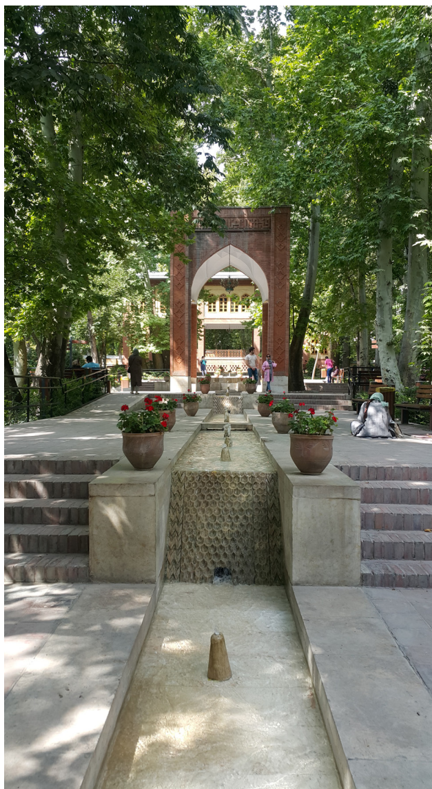
تصویر ۳: محور شمالی-جنوبی بوستان باغ ایرانی.

باغ چهل‌ستون به‌شهر و محور اصلی شرقی-غربی (تصویر ۲) با الگوی باغ فین کاشان طراحی شده است (حیدرنتاج، ۱۳۹۲). منظره‌پردازی با الگوی زیبایی‌شناسی ایرانی باعث جذب مخاطبان زیادی به این باغ شده تا جایی که می‌توان ادعا کرد منظره‌پردازی باغ بیشتر از سایر عوامل در جذب جمعیت مؤثر بوده است (آتشین‌بار و همکاران، ۱۳۹۴) و (مطلق‌زاده، ۱۳۸۱). وجود محورهای اصلی و فرعی باغ که باعث جهت‌دهی فضایی به مخاطب می‌شود، چشم‌اندازهای متفاوتی را نیز در هریک از این مسیرها عرضه می‌کند. وجود درختان در حاشیه مسیرها دید به اطراف را محدود کرده و توجه انسان با قرار گرفتن در محور اصلی، به طی کردن مسیر و ساختمان کوشک در انتهای آن معطوف می‌شود. علاوه بر فضاهای متنوع ایجادشده در حرکت