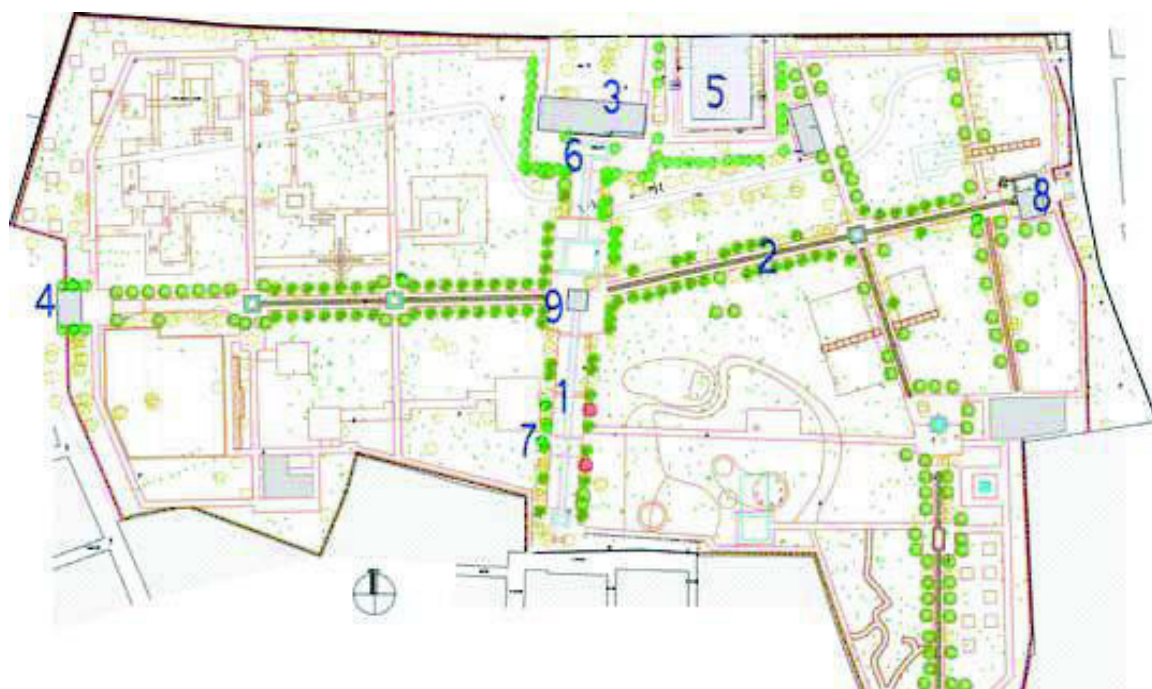
تصویر ۱: محوربندی و تأکید بر هندسه در نقشه بوستان باغ ایرانی (باغ مستوفی‌الممالک). ده‌ونک، تهران.

در حال حاضر طراحی فضاهای سبز با تقلید صرف از پارک‌های اروپایی، پارک‌های ما را به فضاهایی مشابه، بی‌هویت و با هزینه‌های بالای نگهداری تبدیل کرده است. این در حالی است که اگر فضایی خاطرات مخاطب خود را برانگیزد و ذهنیتی را برای او ایجاد کند بر او تأثیر مهم و فزاینده‌ای خواهد داشت (مشوی و وحیدزادگان، ۱۳۹۳). باغ‌های ایرانی تاریخی، مانند بسیاری از مناظر فرهنگی برای شهروندان ایرانی که فضاهای سبز شهری را به عنوان نمادهای شهر و منابع هویت محلی در نظر می‌گیرند، مهم هستند. این نگرش، باغ‌ها را نه تنها از لحاظ فیزیکی و بصری قابل توجه می‌سازد بلکه از لحاظ اجتماعی و فرهنگی نیز قابل دوام می‌کند. بنابراین، باغ‌های ایرانی تاریخی را می‌توان به عنوان میراث فرهنگی پایدار که به طور بالقوه به پایداری شهری کمک می‌کند، طبقه‌بندی کرد. (Rostami, Lamit, Khoshnava, Rostami & Fitry Rosley, 2015) ایجاد احساس تعلق و هویت‌مندی از طریق به کارگرفتن اصول زیبایی‌شناسی باغ ایرانی به عنوان فضایی دارای پیشینه و قدمت در زندگی، تاریخ، فرهنگ و اندیشه ایرانیان می‌تواند راهکار مؤثری جهت سرزندگی این گونه فضاها باشد. در ادامه به بررسی و تحلیل دو نمونه موفق از پارک‌های شهری معاصر تهران پرداخته شده است.