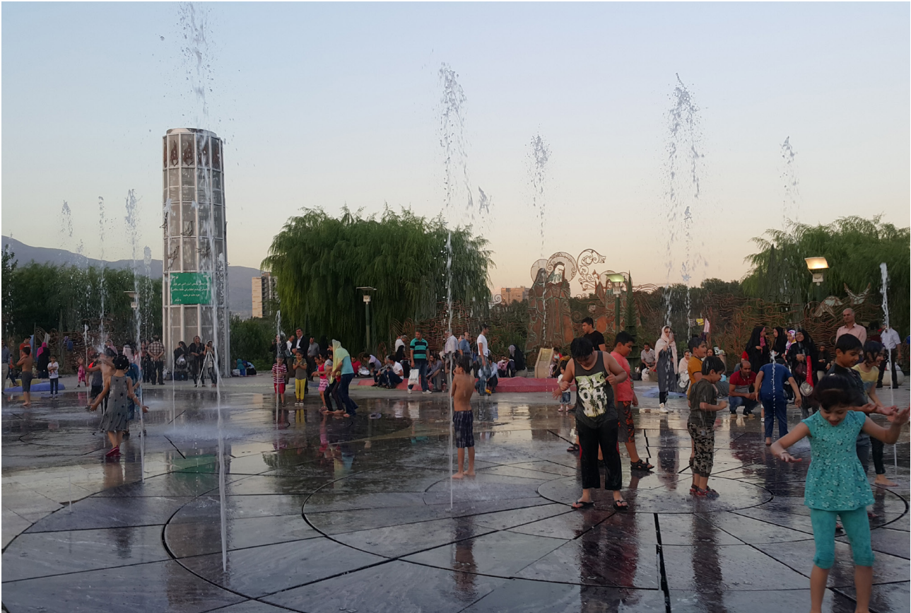
تصویر ۶: حضور آب در بوستان آب و آتش.