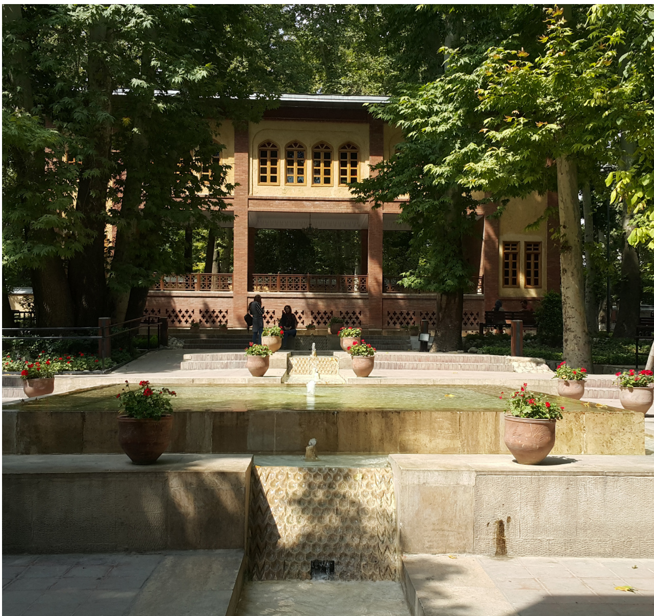
تصویر ۴: کوشک و حضور آب در بوستان باغ ایرانی. عکس: مریم محسنی‌مقدم، ۱۳۹۶.

ایجاد دید و منظر داخلی با قراردادن ناظر در ارتفاع به واسطه وجود کوشکی در بالاترین بخش باغ، در شمال محور اصلی در نظر گرفته شده است (حیدرنتاج، ۱۳۹۲). چشم‌انداز این قسمت به علت اشراف به تمام فضای باغ دارای جذابیت خاصی برای مخاطبان است. نکته‌ای که می‌توانست نقش باغ ایرانی را به مثابه یک فضای جمعی در ذهن ساکنین تهرانی بیش از پیش ماندگار سازد، مکان قرارگیری آن در لبه بزرگراه چمران است که مانند یک نظرگاه، مقطعی از غرب تهران را به نمایش می‌گذارد. در طرح مشاور، این بخش ورودی غربی باغ از بزرگراه چمران طراحی شده اما موانع اداری در مالکیت زمین باعث شد بخش نظرگاه پروژه تا کنون اجرا نشود (آتشین‌بار و همکاران، ۱۳۹۴).