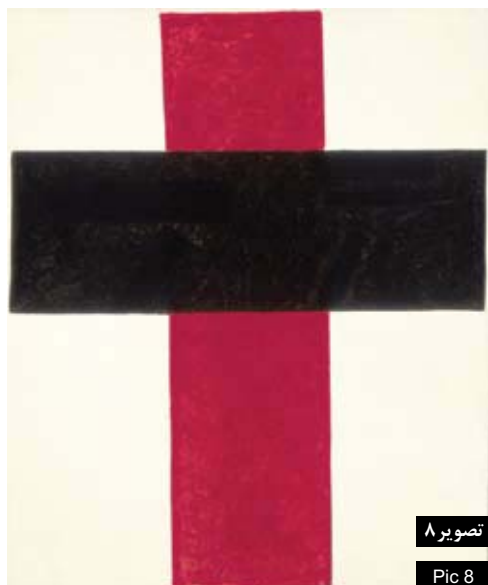
تصویر ۸ Pic 8

تصویر ۸ : تقاطع. اثر کازمیر مالوویچ. حذف همه چیز در آثار مینیمالیستهای مدرن برای رسیدن به فرم خالص.