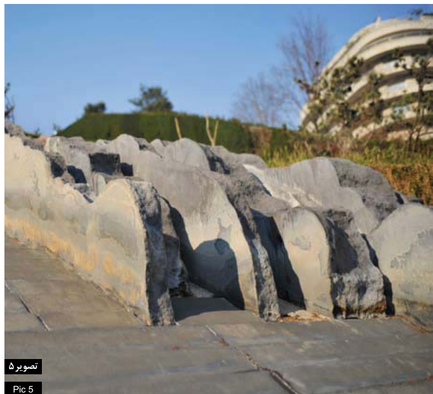
تصویر ۵ Pic 5