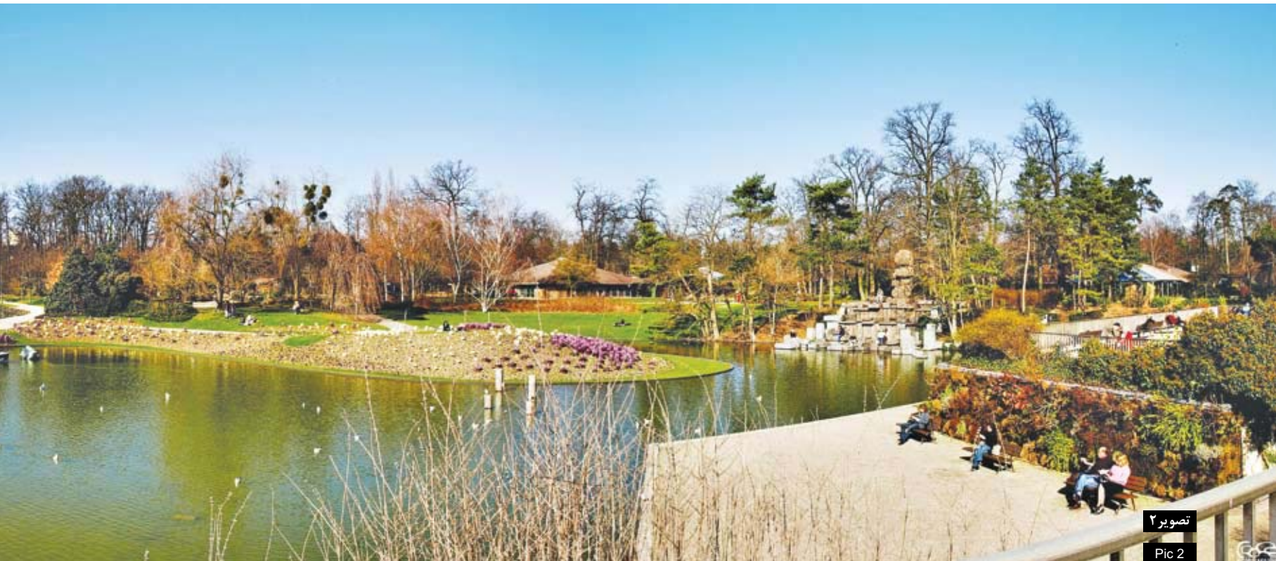
تصویر ۲ Pic 2

پروو در ۱۹۶۰ و ۱۹۷۰ با طراحی دو پروژه عظیم فضای سبز شهری، خود را مطرح می‌کند. باغ گیاهان آبی (Aquatic Garden) به عنوان بخشی از باغ گل «بود وینشن» نخستین پروژه حرفه‌ای پروو است. او در این دوران متأثر از آثار روبرتو برل مارکس (Roberto Burle Marx)؛ (Lin, 2006) و پارک‌های قرن ۱۹ پاریس، رویکردی طبیعت‌گرا دارد. خطوط منحنی و ارگانیک پیاده‌راه‌ها و برکه‌ها، اشکال غالب در طراحی وی برای این باغ هستند (تصویر ۲). در پروژه پارک کورنوو نیز فرم‌های نرم و پوشش گیاهی هرس نشده به پارک چهره‌ای طبیعی بخشیده است. در این پارک، مداخله در زمین با ایجاد اشکال هندسی عظیم (که در طی چند سال سبز شدند) نشانی از تأثیر هنر زمینی در کار آلن پروو دارد. نکته مهم در آثار نخست آلن پروو، نظم پنهان در طبیعت‌گرایی وی است. تمایل به