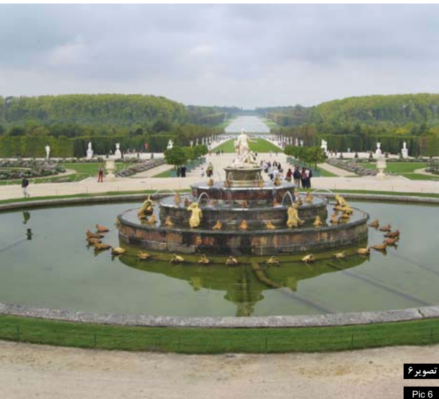
تصویر ۶ Pic 6

تصویر ۵: پارک دیده‌روت. تخته‌سنگ‌های موجود در آبشار یادآور سنگ‌های باغ ذن ژاپنی است. عکس: سید محمد باقر منصور، ۱۳۹۰. Pic5: Parc Diderot. The rocks in cascade remind Japanese Zen rock gardens. Photo by: Seyed Mohammad Bagher Mansouri, 2012.