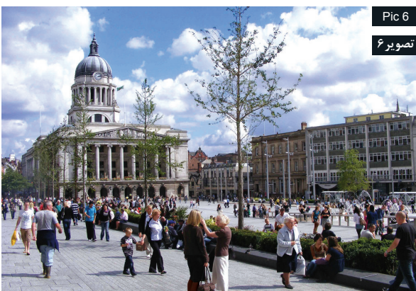
Pic 6 تصویر ۶

www.flickr.com Pic5 & 6: The dominant material in the fountain in three colors, beige granite, gray and black. Source: www.flickr.com