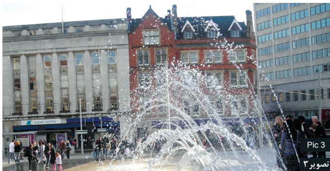
Pic 3 تصویر ۳

www.flickr.com Pic2: Replacing vehicles with tram for easy access to restore the west side of the field. Source: www.flickr.com