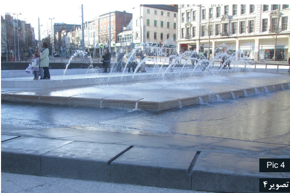
Pic 4 تصویر ۴

www.flickr.com Pic3: Ramps provide access to prams and wheelchairs. Source: www.flickr.com