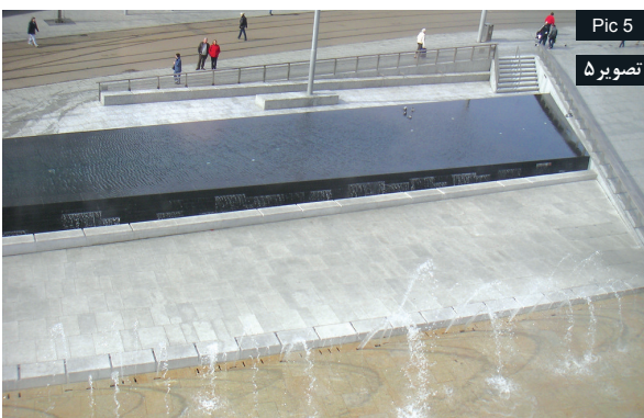
Pic 5 تصویر ۵

www.flickr.com Pic4: Water Use in the design in order to entertain audiences and create diversity in space. Source: www.flickr.com