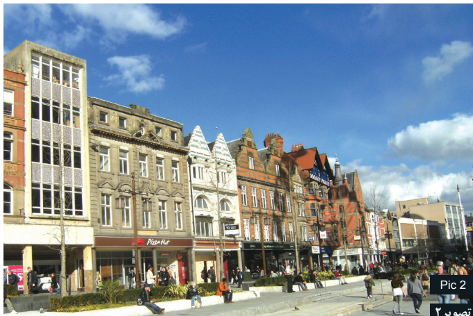
Pic 2 تصویر ۲

آب به عنوان یکی از ویژگی‌های برجسته در این میدان، نمایش و دیدهای متفاوتی را در ضلع غربی به وجود آورده است. مساحت ۴۴۰۰ متر مربع در اطراف چشمه قدیمی میدان ایجاد آبنمایی وسیع اختصاص یافت. لبه‌های آبنما سطح وسیعی برای نشستن و مکث در میدان به وجود آورده است که برای افراد با سنین و سلیقه‌های متفاوت جذابیت