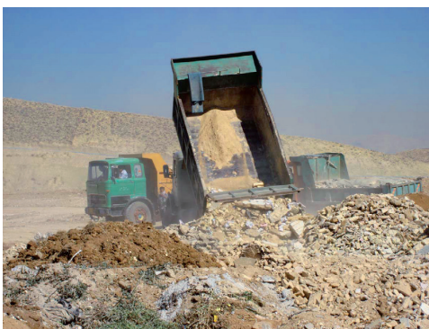
Pic 2 تصویر ۲

Keywords | Urban rehabilitation and renovation, New approaches, Sustainable city plan, Resilient city.