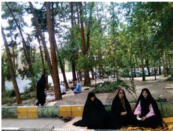
تصویر ۲: محوطه بیمارستان به عنوان محل تجمع ملاقات‌کنندگان مورد استفاده قرار می‌گیرد.

دستیابی به نتایج فوق مفهوم سکونت در بیمارستان امام را هویدا کرد؛ از بیمارانی که تا ماه‌ها بر تخت بیمارستان‌ها بستری هستند تا همراهان بیماران و حتی پزشکان که تا سه روز هم در صورت نیاز در محیط بیمارستان سکونت دارند (جدول ۵). انسان بیشتر عمر خود را در فضاهای مکان‌مند به سر می‌برد؛ خانه، محل کار، محل عبادت، این فضاها محل سکونت‌اند یعنی باید آدمی را از گزند هر آنچه سلامت جسم و جانش را تهدید می‌کند، در امان دارند. سکونت‌گزیدن مستلزم ساختن نیز است که علاوه بر معنای ظاهری آن، که بنا کردن است، معنی تربیت،