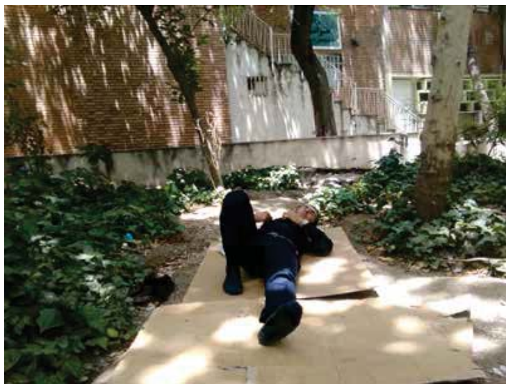
تصویر ۱: محوطه بیمارستان که به عنوان محل اسکان همراهان بیماران مورد استفاده قرار گرفته است. عکس: مریم زاهدی، ۱۳۹۵.