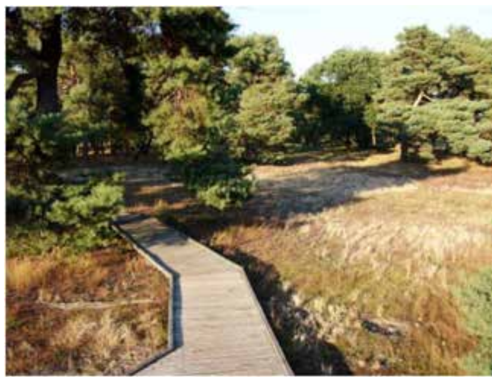
تصویر ۶: مسیر پیاده‌روی.