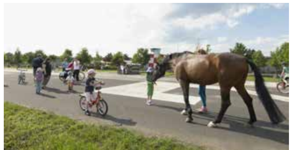
تصویر ۲: زمین‌بازی و ورزشی کودکان بر روی باند فرودگاه قدیمی.

برای مداخله مناسب در طبیعت مطابق با روند پایداری باید