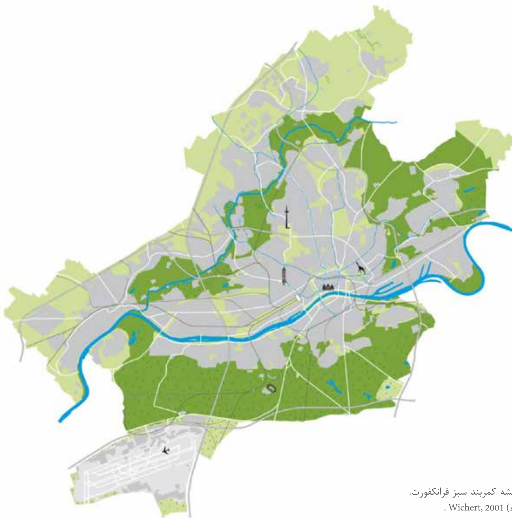
تصویر ۱: نقشه کمربند سبز فرانکفورت.

کمربند سبز فرانکفورت شش‌های شهر است. پوشش ۸۰۰۰ هکتاری آن حدود یک‌سوم از مساحت شهر و کمربندی تقریباً ۷۰ کیلومتری در طول جغرافیایی اطراف شهر را شکل می‌دهد که شامل ۴۰ پارک، ۲۰۰ جاذبه گردشگری، ۳۵۰ کیلومتر شبکه جاده‌ای و تعداد زیادی برنامه‌های آموزشی می‌شود (تصویر ۱). مشخصه ویژه کمربند سبز فرانکفورت تنوع منظرهای متفاوت و مجموعه غنی از زندگی گیاهی و حیوانی است. این کمربند محدوده گسترده‌ای از مناظر فرانکفورت را شکل می‌دهد و شامل باغ‌های میوه، چمنزارها، نواحی محیط‌زیست طبیعی، نهرها، کشتزارها، پارک‌ها، بوستان‌ها، مناطق استراحت گاهی و ورزشی می‌شود که جهان کوچکی از مناظر را در ناحیه «راین-مین» ۳ ایجاد می‌کنند. وجود امکانات باکیفیت مطلوب