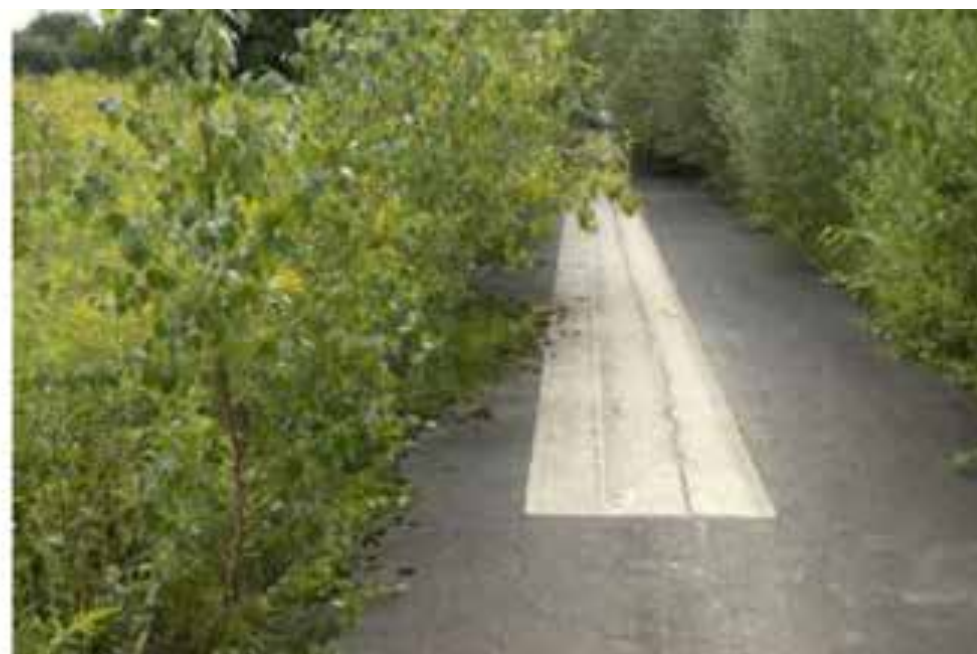
تصویر ۴: باند فرودگاه تغییر شکل یافته در راستای بهره‌بری اکولوژیکی در سال ۲۰۰۳ و رشد گونه‌های طبیعی گیاهان در منطقه فرودگاه در سال ۲۰۱۰.

فعالانه با عناصر طبیعی همچون چوب، خاک، آب‌و‌آتش پیش‌بینی شده است (تصاویر ۳ و ۲). در محدوده کمربند سبز فرانکفورت سایتی نظامی وجود داشت که به پارک تبدیل شده و با فعالیت‌های تفریحی همچون اسکیت‌بازی، کایت‌سواری یا محلی برای پیک‌نیک تطبیق پیدا کرده است. باند بتنی فرودگاه هواپیما در محدوده نیز در بخش‌هایی تخریب شده و از خاک زیر بنایی آن برای حمایت از رشد زندگی گیاهی استفاده می‌شود و قسمتی از آن به زمین‌بازی کودکان تبدیل شده است، درعین حال قسمت کمی از این باند برای ایجاد معبر پیاده از میان گیاهان طبیعی حفظ شده است. این تغییر شکل فرودگاه قدیمی برای فعالیت‌های عمومی با رویکرد اکولوژیکی به‌خوبی طراحی شده است و زیستگاه طبیعی نیز در این سایت اصلاح شده است (تصویر ۴). جاذبه‌های فرهنگی جذابی در