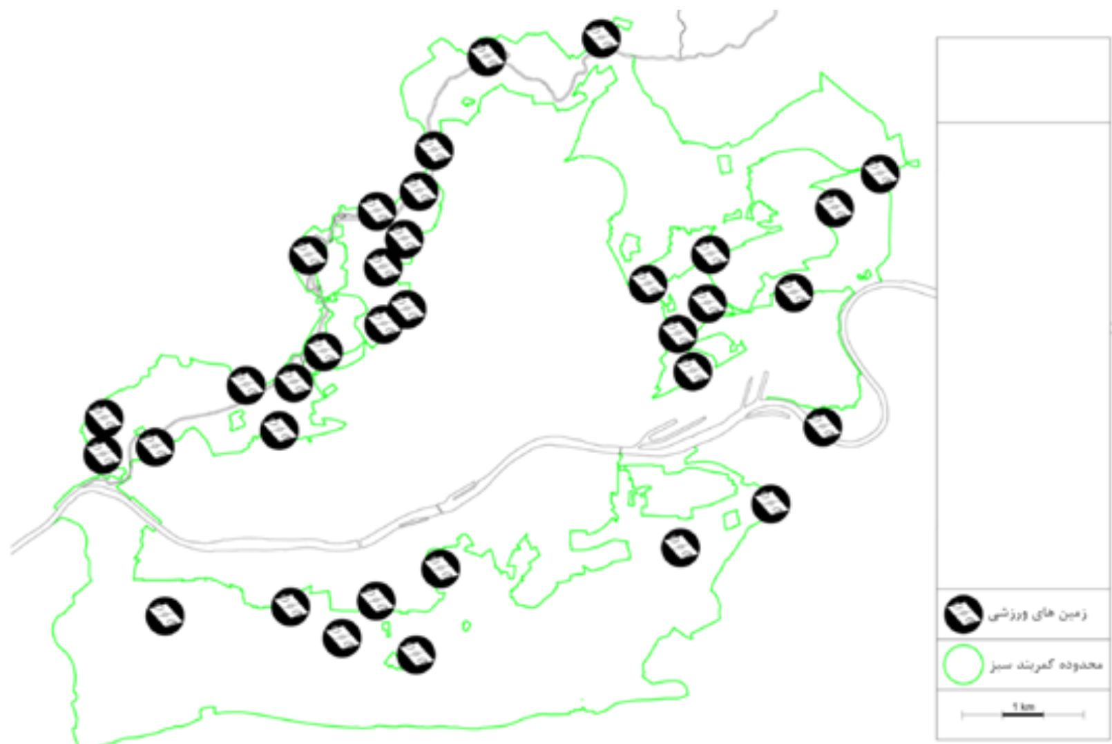
تصویر ۳: نواحی ورزشی متعدد در کمربند سبز فرانکفورت.