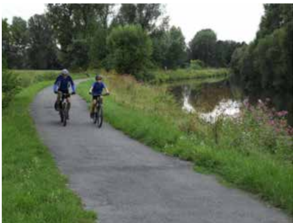
تصویر ۵: مسیر دوچرخه‌سواری. مأخذ: 21: (A) :Wichert, 2001.