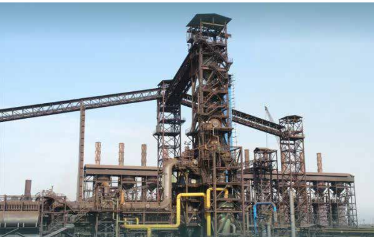
تصویر ۹: فولاد خوزستان اهواز، صنعت فولاد علی‌رغم آنکه برای شکل‌گیری.