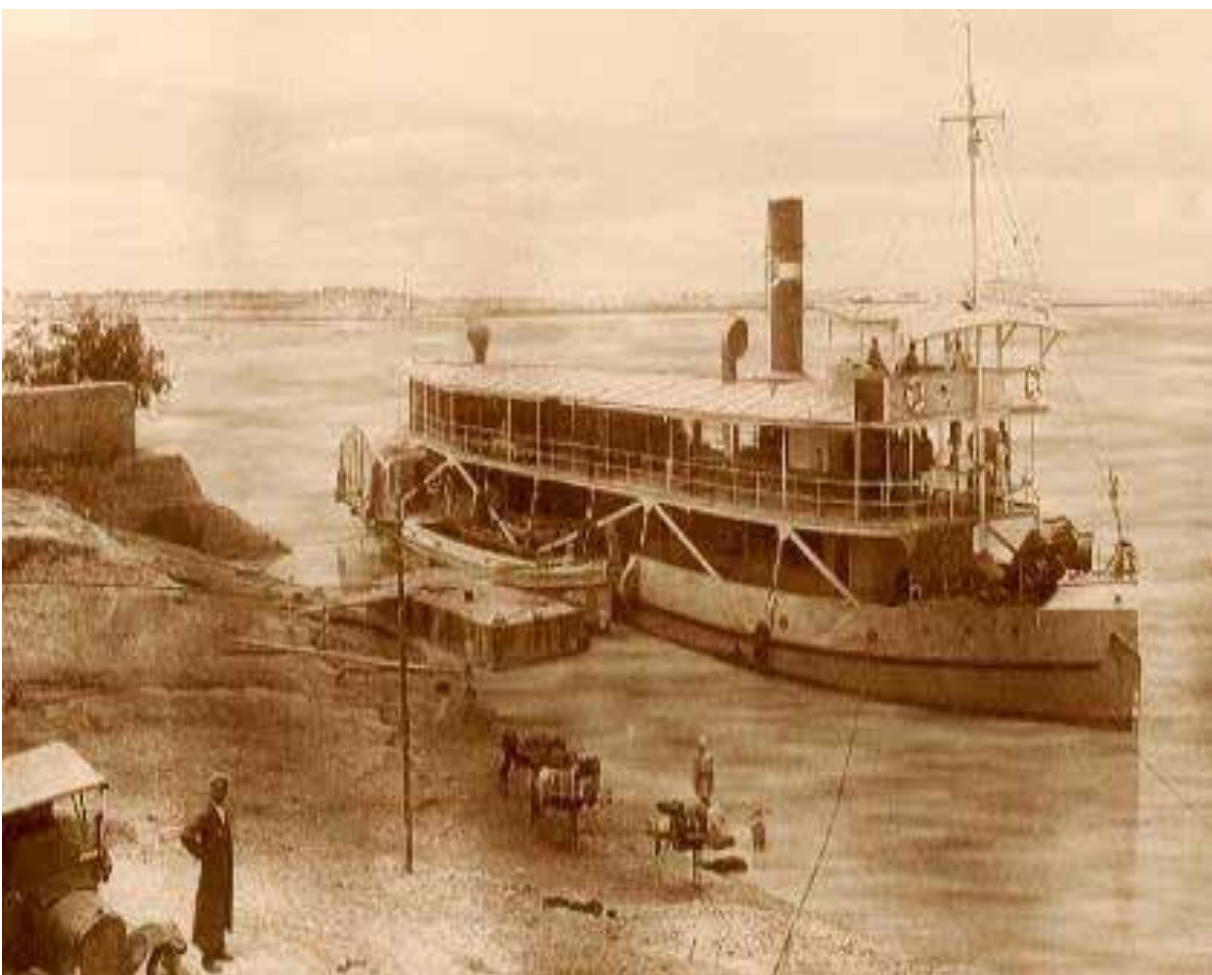
تصاویر ۶ و ۷: کشتیرانی در اهواز. مأخذ: www.khuznews.ir (تاریخ مراجعه ۱۳۹۴/۰۸/۲۰).

بازهم بر روی بستر صخره‌ای بناشده بود مانع دیگری برای کشتیرانی بوده است. شاخه بالادست یا کارون شمالی از شوشتر تا اهواز و شاخه جنوبی یا پائین دست از اهواز تا خلیج فارس را در برمی گرفته است. بنابراین کشتی‌هایی که از شوشتر حرکت می‌کرده‌اند در محل اهواز به ناچار بار خود را به کشتی دیگری در سمت جنوبی صخره منتقل می‌کرده‌اند (تصاویر ۶ و ۷). این دست‌به‌دست شدن بار موجب پیدایش انبارها و کاروانسراهای متعددی در اهواز شد و تبدیل به یکی از دلایل رونق تجارت و در نتیجه رونق شهر اهواز شد (مجتهدزاده و نام‌آور، ۱۳۸۵: ۲۳۳-۲۳۲). احداث بندر ناصری در این محل به دستور ناصرالدین شاه