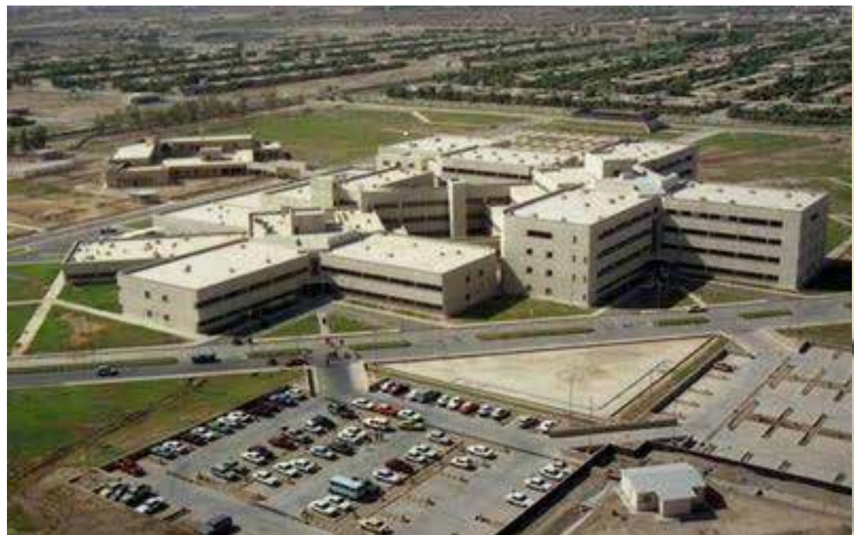
تصویر ۸: شهرک نفت اهواز، با توسعه یافتن تکنولوژی‌های نوینی چون صنایع مرتبط با نفت، فولاد و... شهری که در گذشته برای رفع نیازهای اقتصادی نیازمند تعامل منسجم با رودخانه بود اکنون می‌توانست بدون حضور آن نیز به حیات خود ادامه دهد.