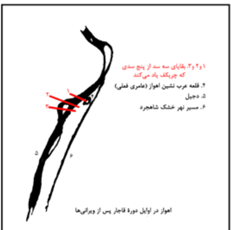
تصویر ۵: اهواز در اوایل دوره قاجار پس از ویرانی‌ها. مأخذ: مجتهدزاده و نام‌آور، ۱۳۸۵.

مشمتمل بر دو بخش بوده است: در یکی بزرگان و اشراف و در دیگری بازاریان سکنی داشتند. شهر بزرگان را هرمشیر و شهر بازاریان را هوجستان و اجار، به معنای بازار خوزستان می‌نامیدند (افشاری سیستانی، ۱۳۶۴: ۶۸-۶۵). کاوش‌های باستان‌شناسی و همچنین متون تاریخی که از بقایای ابنیه ملوک العجم در اهواز یاد کرده‌اند، نشان می‌دهد که هرمشیر یا شهر بزرگان در محل ارتفاعات شرق شهر اهواز و شهر مردمی یا هوجستان و اجار بر زمین سطح غربی این ارتفاعات در حاشیه رودخانه کارون واقع بوده است. اهواز در این روزگار یکی از مراکز نساجی در خوزستان به شمار می‌رفت و نیز به سبب واقع شدن در کنار رود کارون که قابلیت کشتیرانی داشته، محل مناسبی برای تجمع مال‌التجاره و دادوستد محسوب می‌شد. در این دوره رفت‌وآمد بازرگانان موجب شد رفته‌رفته هوجستان و اجار رونق گیرد و به مرکزی برای تجارت ابریشم و نیشکر بدل شود (مجتهدزاده و نام‌آور، ۱۳۸۵: ۲۳۰-۲۲۸)؛ (تصاویر ۳ تا ۵).