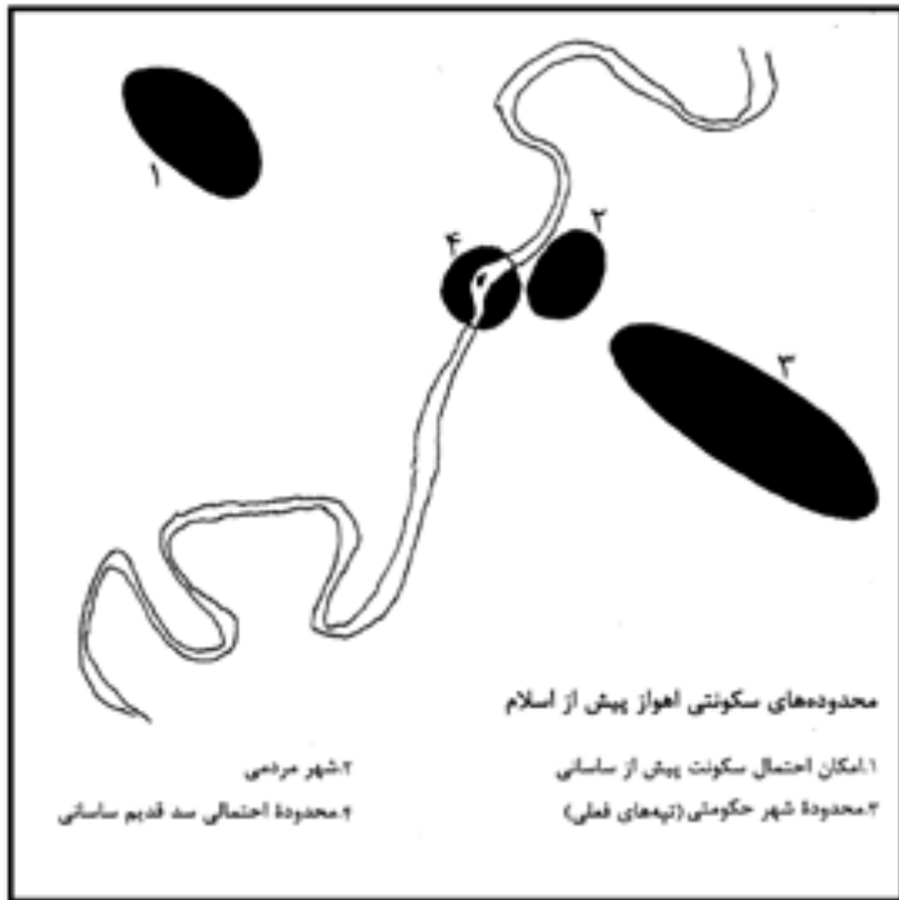
تصویر ۳: محدوده‌های سکونت اهواز پیش از اسلام.