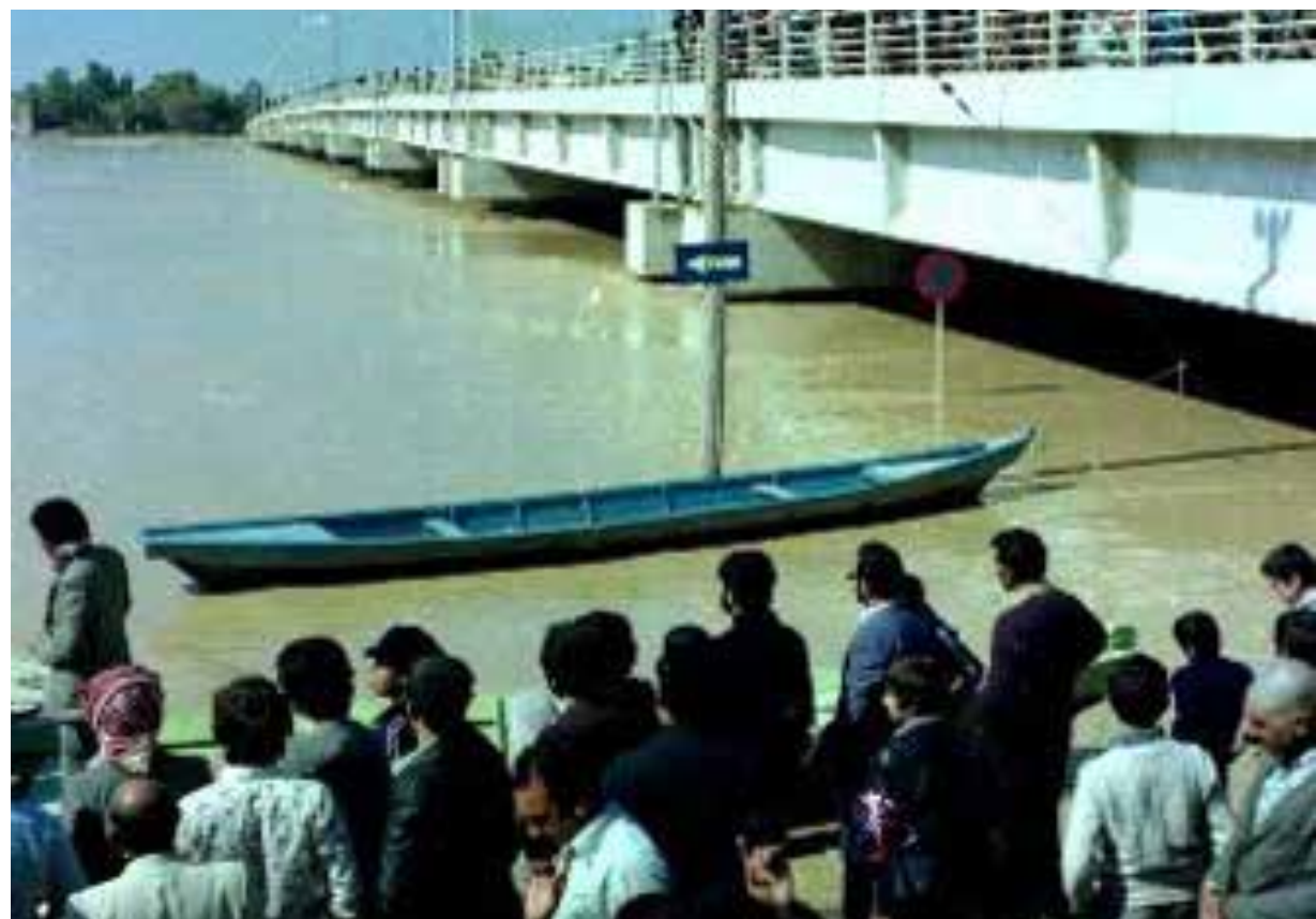
تصاویر ۱۰ و ۱۱: بالا آمدن سطح آب کارون، تغییرات سطحی در آب کارون یکی از موانعی در دوره معاصر برای نزدیک شدن لبه شهری به رودخانه بوده است. مأخذ: www.khuznews.ir (تاریخ مراجعه ۱۳۹۴/۰۸/۲۰).