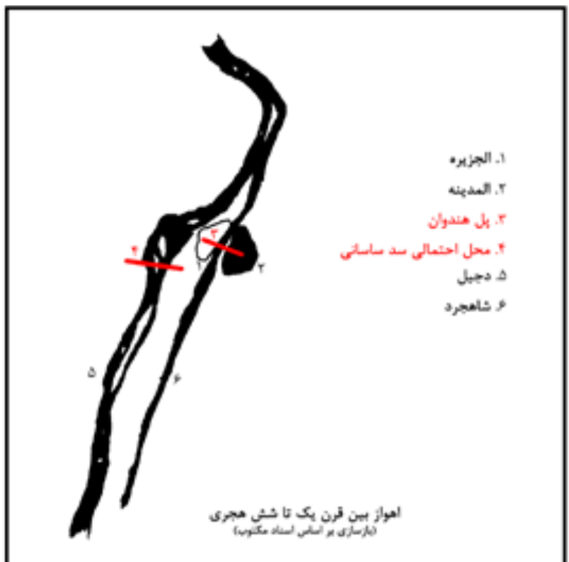
تصویر ۴: اهواز بین قرن یک تا شش هجری.