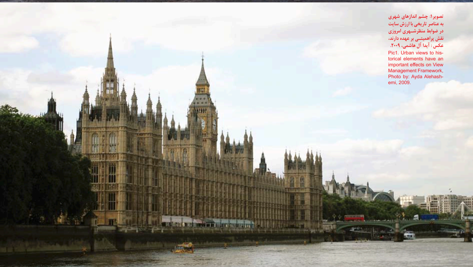
تصویر ۱: چشم اندازهای شهری به عناصر تاریخی با ارزش سایت در ضوابط منظر شهری امروزی نقش پراهمیتی بر عهده دارند. عکس: آیدا آل‌هاشمی، ۲۰۰۹. Pic1. Urban views to historical elements have an important effects on View Management Framework, Photo by: Ayda Alehashemi, 2009.