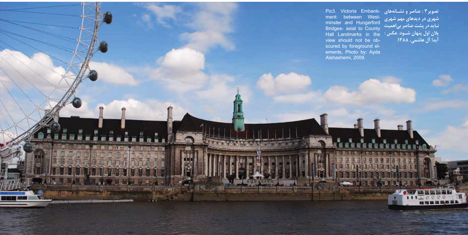
تصویر ۳: عناصر و نشانه‌های شهری در دیدهای مهم شهری نباید در پشت عناصر بی‌اهمیت پلان اول پنهان شود. عکس: آیدا آل‌هاشمی، ۱۳۸۸. Pic3. Victoria Embankment: between Westminster and Hungerford Bridges- axial to County Hall Landmarks in the view should not be obscured by foreground elements, Photo by: Ayda Alehashemi, 2009.