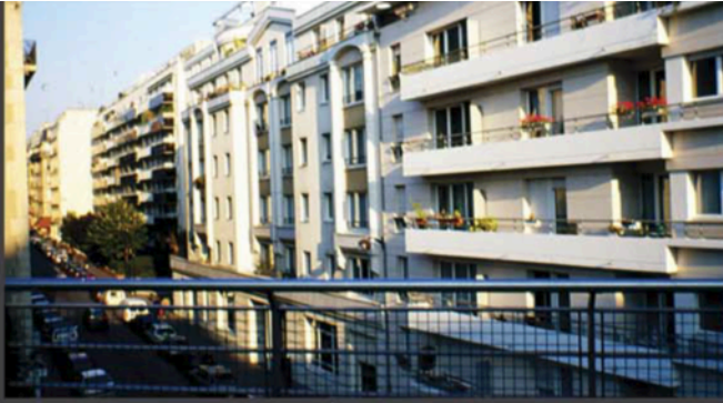
۶: تلاش ساکنین در نظافت و زیباسازی نمای ساختمان‌ها.