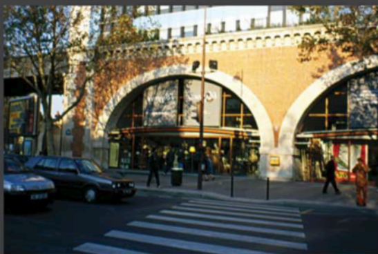
۲: تبدیل فضاهای زیر پل به کاربری‌های مورد نیاز، باعث تعریف مکان شده و بر رونق ناحیه افزوده است، مأخذ: نگارنده، ۱۳۶۹.