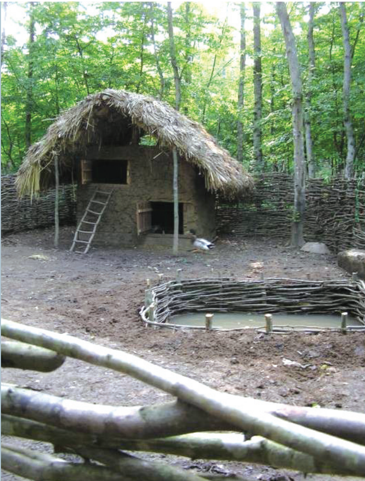
عدم درک صحیح از قلمرو مکان به واسطه نگاه کالبدی صرف، موزه فضای باز روستایی گیلان