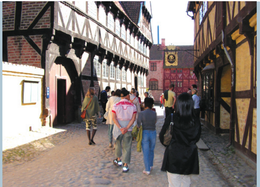
عدم حس تعلق به مکان و خاطرات مشترک در موزه‌های فضای باز، موزه شهر قدیمی «آرهاس»، دانمارک