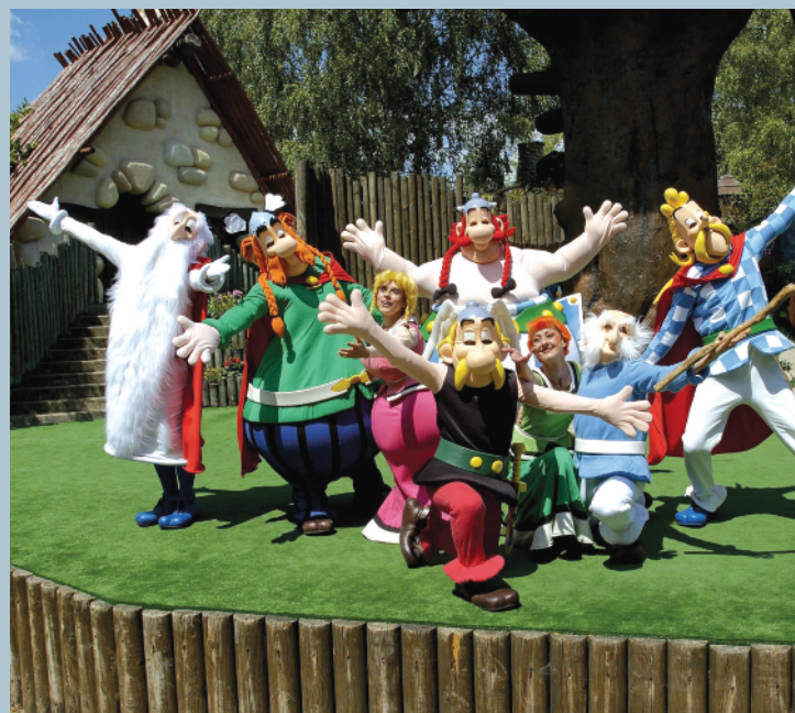
الهام از داستان‌ها و تاریخ مشترک در پارک‌های موضوعی