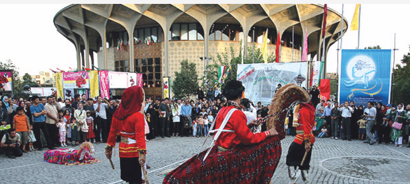
حال و هوای این فضای شهری در ایام برگزاری جشنواره تئاتر فجر

برگزاری اجتماعات هدفدار حول محور تئاتر، فعالیت‌های فرهنگی خودجوش متأثر از محیط و تجمعات موسمی در صحن تئاتر شهر همچون تجمعات ۸ مارس به مناسبت روز جهانی زن، ۱۹ شهریور، روز آزادی نرم‌افزار و ۲۰ دسامبر، روز جهانی مبارزه با ایدز، خود گواهی بر موفقیت این فضا در گرد هم آوردن شهروندان و تحقق مشارکت مدنی آنان است.