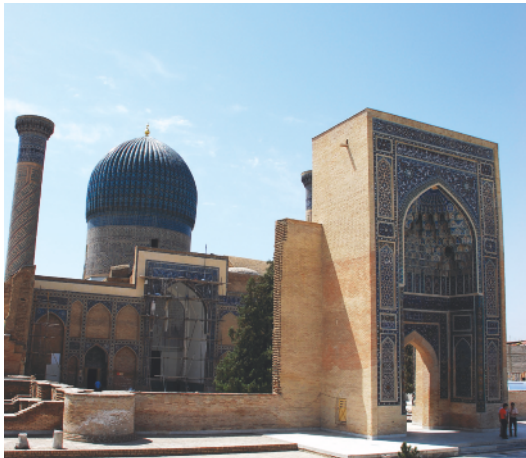
مقبره امیر تیمور، سمرقند، مآخذ: نگارنده، ۱۳۸۸.

بر همین اساس، نوعی تفسیر از منظر شهری در شهرهای این سرزمین شکل می‌گیرد که حاصل رابطه مرید و مراد و استاد و شاگردی است؛ نوعی تقدیس «مولا»: منظر مولوی. به عبارت دیگر، منظر مولوی، تفسیری است از منظر شهری سرزمین‌های تاریخی آسیای مرکزی که پدیده‌ای یگانه است، به طوری که در دیگر گونه‌های شهرها مشاهده نمی‌شود. در شهرهای مسیحیان و مسلمانان هرگز چنین تفسیر غالبی از منظر شهری نمایان نیست.