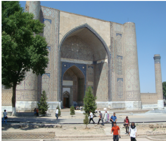
مسجد بی‌بی خانم، سمرقند.