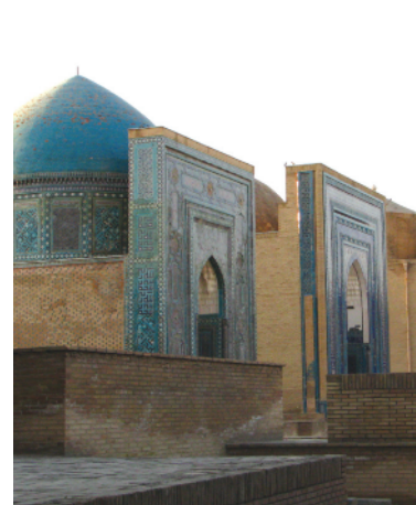
مجموعه آرامگاهی شاه زنده، سمرقند مآخذ: نگارنده، ۱۳۸۸.