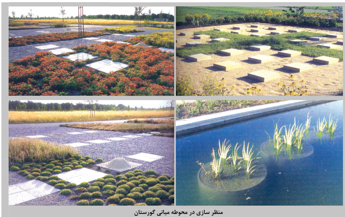
منظر سازی در محوطه میانی گورستان

در تمام راه‌هایی که به گورستان منتهی می‌شوند درختان افرا، بلوط و لیمو کاشته شده است. درختان میوه که در ردیف سنگ‌مزارها قرار گرفته‌اند، تغییر فصول را یادآوری می‌کنند. در لبه هر ردیف از سنگ‌مزارها، فضاهای آرامی که تحت سایه درختان گردو قرار دارند نیز دیده می‌شود. همچنین آبنا‌های ساخته‌شده از سنگ آهک در این گورستان به چشم می‌خورد که توسط «کریستین هینگ» (Christian Hing)، مجسمه‌ساز معروف طراحی شده است. در کل همان‌طور که اشاره شد، طراحی این قسمت از گورستان با تکیه بر اصول منظرسازی و بهره‌گیری از عناصر طبیعی منجر به ساماندهی خلاق محیط شده و تصویری متفاوت از گورستان را ایجاد کرده است. (Nicolette baumeister, 2007).