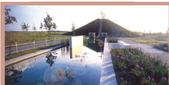
چشم‌انداز تپه از کنار آبنا