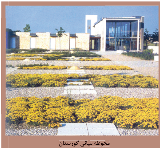
محوطه میانی گورستان