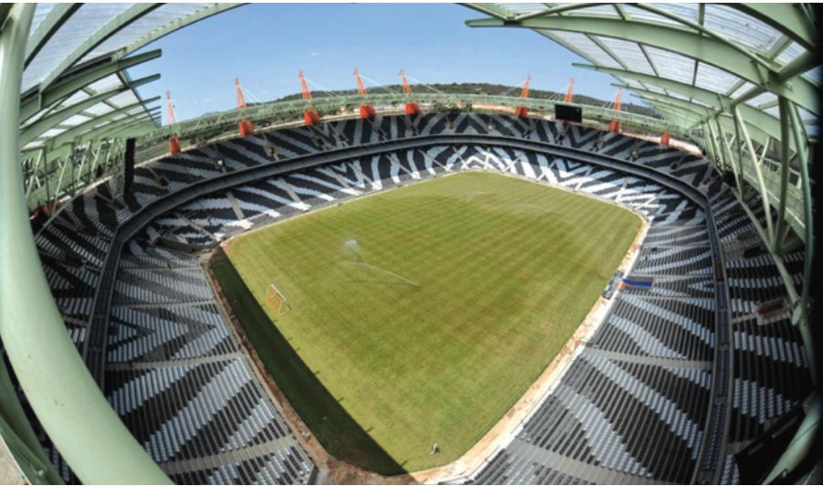
طراحی ورزشگاه با الهام از حیات وحش