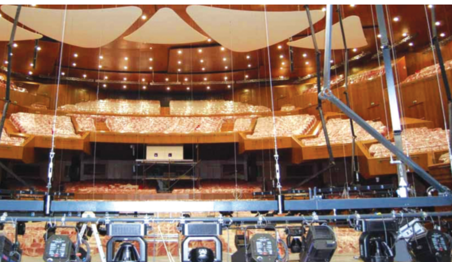
بزرگترین سالن موسیقی در قزاقستان

یکی از بزرگترین سالن‌های موسیقی جهان با ۳۵۰۰ صندلی در شهر آستانه، پایتخت جدید قزاقستان افتتاح شد و کنسرتی به مناسبت جشن هجدهمین سالگرد استقلال قزاقستان در این سالن برگزار شد. به گفته طراحان، «Manfredi Nicoletti» و «Luca Nicoletti»، ساختمان به شکل گلی طراحی شده است تا با سایت که دارای منظره بیابانی و طبیعی خشن است، در تضاد باشد و بدین وسیله خود را بیشتر بنمایاند. بدنه سالن نیز شبیه به گلبرگ‌های متحرکی طراحی شده است که گویی با موسیقی داخل سالن در حرکت است. به دلیل شرایط سخت آب‌وهوایی قزاقستان که محدوده تغییرات دمایی آن از (۴۰- تا ۴۰+) درجه سانتیگراد است، رعایت اصول اقلیمی و سازه ساختمان اهمیت ویژه‌ای پیدا می‌کند.