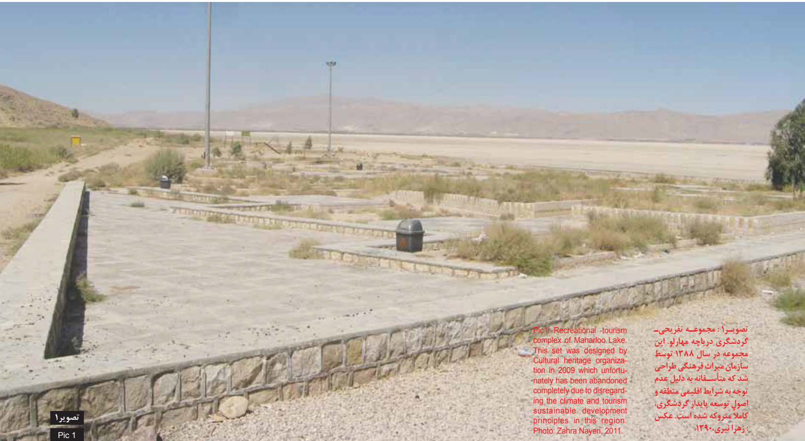
نصویر ۱: مجموعه تفریحی- گردشگری دریاچه مهارلو. این مجموعه در سال ۱۳۸۸ توسط سازمان میراث فرهنگی طراحی شد که متأسفانه به دلیل عدم توجه به شرایط اقلیمی منطقه و اصول توسعه پایدار گردشگری، کاملاً متروک شده است.