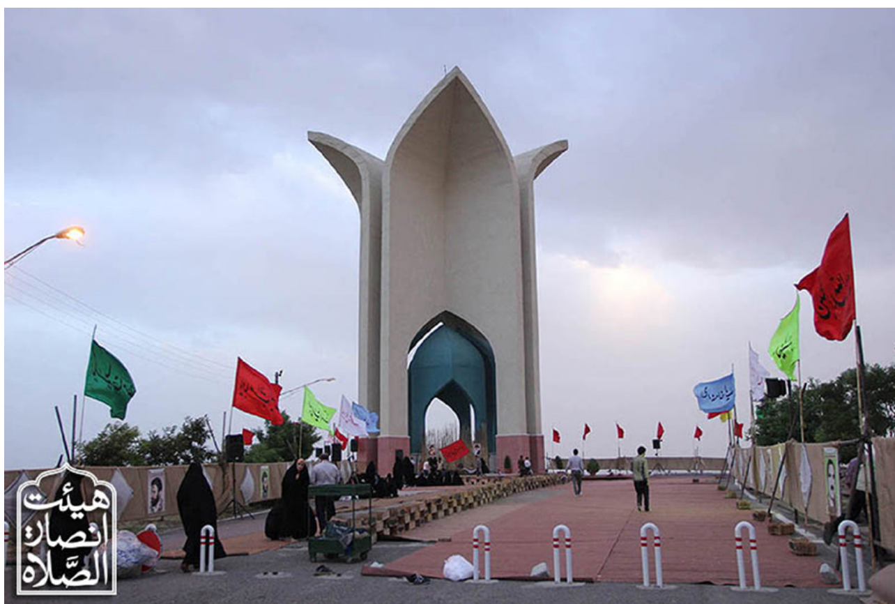
تصویر ۸: یادمان شهدای کشور در حومه شهر قزوین.

این بنا دارای دو چهارطاق بزرگ داخلی و خارجی جمعاً هشت طاق به یاد هشت سال دفاع مقدس و هشت شهید گمنام این مزار است. ارتفاع سازه بیرونی این بنا که بلندترین یادمان شهدای گمنام کشور است ۳۶ متر و ارتفاع سازه درونی ۱۵ متر از سطح زمین مجاور است که ترکیب این دو مقیاس با دو رویکرد برون‌گرا در مقیاس شهری و درون‌گرا در مقیاس انسانی و با استفاده از یک فرم واحد، ضمن سادگی در طرح دو مفهوم متضاد را القا می‌کند (تصویر ۸).