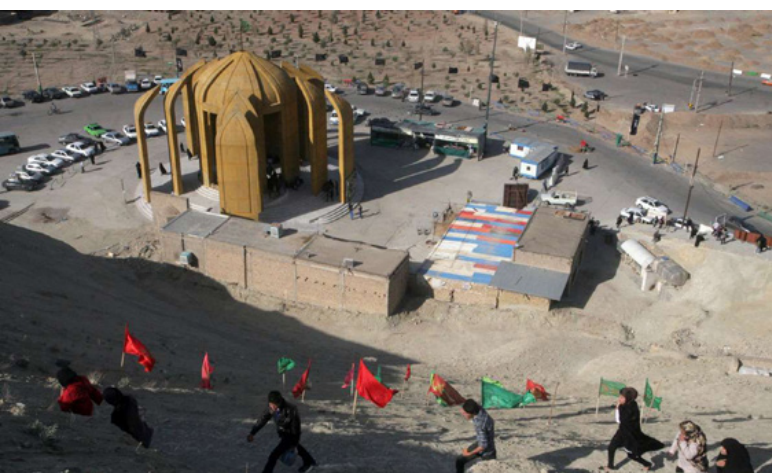
تصویر ۷: یادمان شهدای گمنام قم.