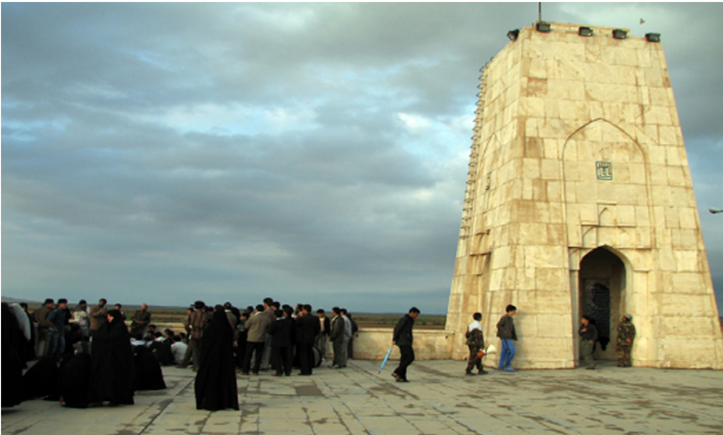
تصویر ۱۱: یادمان دهلاویه (شهید چمران).

یادمان شهید چمران نیز به قصد تأکید بر مکان وقوع یک اتفاق تأثیرگذار در طول جنگ احداث شده است. این اثر تداعی‌گر معماری مقبره‌ای است و از سوی دیگر فرم برجک‌های دیدبانی را به ذهن متبادر می‌کند. این یادمان به لحاظ معماری اثری با هویت محسوب می‌شود اما مخاطب به‌سختی می‌تواند ارتباط بصری و ذهنی با واقعه (اصابت خمپاره و شهادت دکتر چمران) برقرار کند.