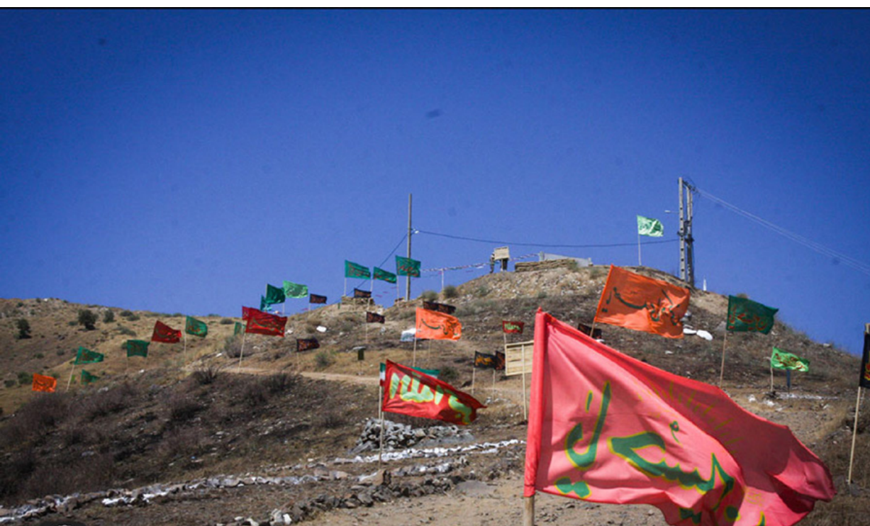
تصویر ۱۰: یادمان شهدای بوالحسن.