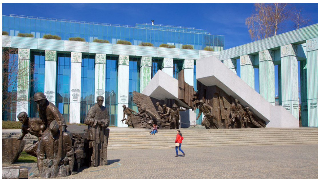
تصویر ۵: یادمان قیام ورشو.