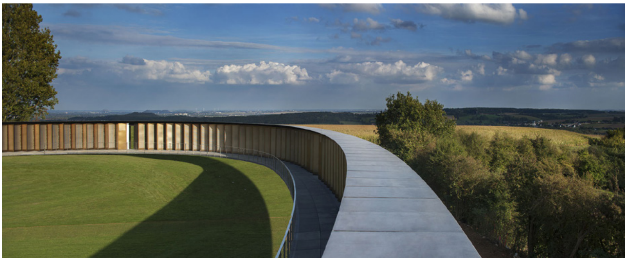
تصویر ۱۳ : حلقه یادمان جنگ جهانی اول در فرانسه، این اثر ترکیبی از فرم‌های انتزاعی و بیان استعاره‌ای است.

به همین ترتیب می‌توان برای انتقال مفاهیم ارزشی به مخاطب از فرم‌های انتزاعی و الگوهای استعاره‌ای بهره جست. رنگ قرمز به‌تنهایی می‌تواند نماینده مفهوم شهادت باشد (رد پای قرمز بر روی زمین در یادمان جنگ بوسنی و هرزگوین). الزاماً نیازی نیست که یک مجسمه در ابعاد واقعی ساخته شود تا مرگ یک انسان را به تصویر بکشد. به‌ویژه آنکه ذائقه نسل امروز دگرگون شده و به پیچیدگی تمایل دارد. تصویر ۱۴ نشان می‌دهد که در طراحی یادمان‌ها با یک طیف مواجه هستیم که یک‌سوی آن استعاره و فرم‌های انتزاعی است و سوی دیگر آن واقع‌نمایی و معماری فرمال خواهد بود.