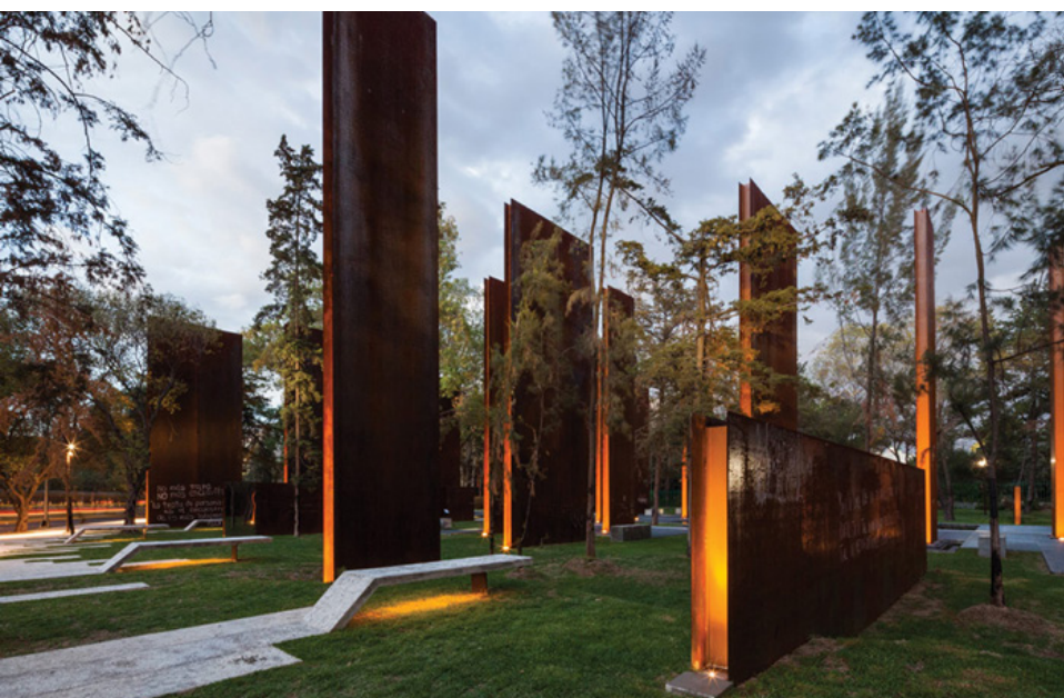
تصویر ۳: یادمان قربانیان مکزیکوسیتی. مفهوم ایستادگی و مقاومت در برابر خشونت را در منظر به نمایش درآورده است.