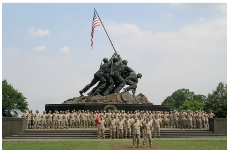
تصویر ۴: یادمان تفنگداران نیروی دریایی آمریکا.

یادمان برای اشاره به رویداد یا معنایی مشخص اما قابل تفسیر بنا می‌شود. این بدان مفهوم است که معمار یا سفارش‌دهنده