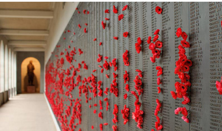
تصویر ۱: یادمان جنگ استرالیا. منظر بناهای یادمانی و شکل کالبدی آن می‌تواند نمادین و انتزاعی باشد.