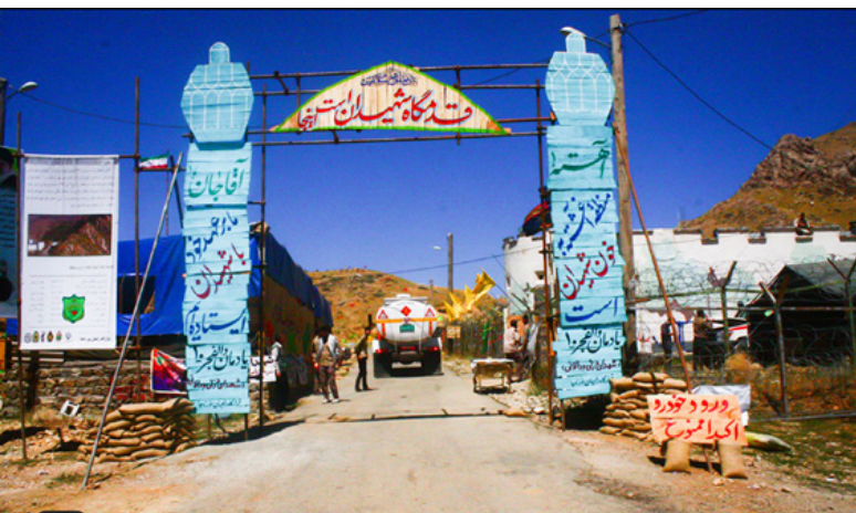
تصویر ۹: یادمان شهدای عملیات والفجر.

این یادمان به قصد حفظ و معرفی یکی از مکان‌های عملیاتی غرب ایران در طول هشت سال دفاع مقدس و شهدای این منطقه برپاشده است. مداخلات در این سایت حداقلی است و با نصب پرچم‌هایی در طول مسیر منتهی به تپه‌ای که محل عملیات بوده اقدام به تعریف فضا کرده‌اند. در قیاس با سایر یادمان‌ها، یادمان بوالحسن از حس فضایی بهتری برخوردار است هرچند تداعی‌کننده وقایع روی داده در مکان فوق نیست