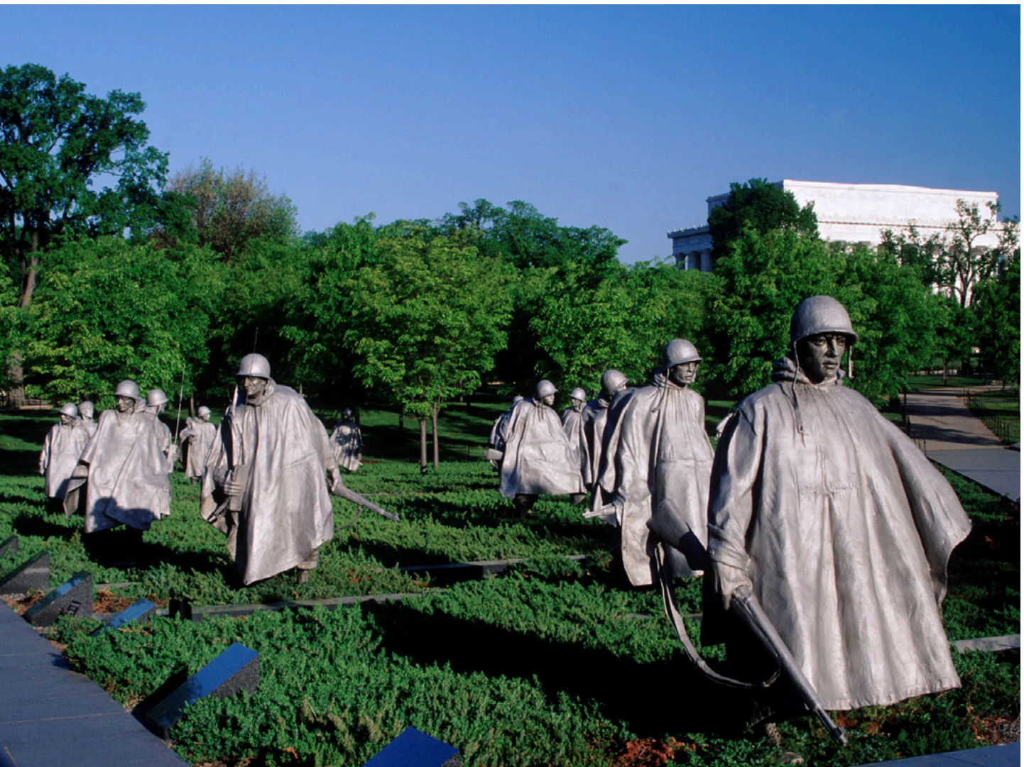
تصویر ۱۲: یادبود جانبازان کره‌ای. این اثر با بیان مستقیم و واقع‌گرایانه به سرعت با مخاطب ارتباط برقرار می‌کند اما به همین نسبت برای بازدیدکننده می‌تواند تکراری و کسالت‌بار باشد.

همچون «یادمان جنگ استرالیا» (تصویر ۲) می‌تواند الگوی مناسبی برای این دسته از یادمان‌ها باشد که از بیانی انتزاعی و سمبولیک بهره گرفته است. دسته دوم مکان‌هایی است که یادآور خاطرات جنگ است. در این حالت بازآفرینی صحنه‌های جنگ و کارکرد موزه‌ای آن‌ها مدنظر است. در این حالت تأکید بر واقع‌نمایی وجود دارد اما برای شاخص کردن مکان می‌توان از فرم‌های انتزاعی استفاده کرد (حلقه یادمان جنگ جهانی اول)؛ (تصویر ۱۳). اما دسته سوم به خاطرات، مفاهیم و ارزش‌های مرتبط با جنگ مربوط می‌شود. در این حالت یک امر ذهنی باید به قامت یک اثر کالبدی درآید. به‌عنوان نمونه