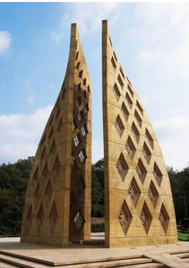
تصویر ۶: یادمان شهدای گمنام جنگل ناهارخوران.

یادمان شهدای گمنام قم در جوار کوه خضر نبی احداث شده است و بام قم محسوب می‌شود. مراحل ساخت آن از قبیل طراحی، تخریب سازه قدیمی و اجرای سازه یادمان توسط معاونت فنی مهندسی بنیاد حفظ آثار و نشر ارزش‌های دفاع مقدس انجام شده و سازه‌های نمادین محسوب می‌شود (تصویر ۷). این یادمان نیز با استفاده از بیانی فرمال و با استفاده از الگوهای رایج در معماری اسلامی که برای بیننده آشنا است،