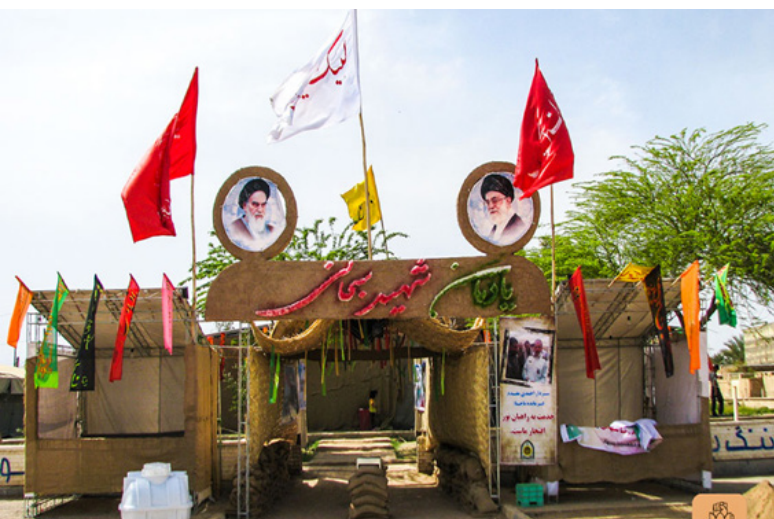
تصویر ۲: یادمان شهید سبحانی - سوسنگرد. در ایران غالباً رویکرد واقع‌نمایی در یادمان‌های جنگ به چشم می‌خورد.

همچنین مفهوم «ایثار» که توأم با شهادت است، در فرهنگ ایران قابل توجه است. در لغت‌نامه دهخدا این کلمه به معنای غرض دیگران را بر خود مقدم داشتن، منفعت غیر را بر خود مقدم داشتن و این کمال درجه سخاوت است (همان). در کنار این مفاهیم جنبه‌های حماسی جنگ نیز حائز اهمیت است. شجاعت‌ها، دلاوری‌ها و مقاومت کسانی که به‌قصد حفظ کیان وطن در صحنه نبرد حاضر شده‌اند.