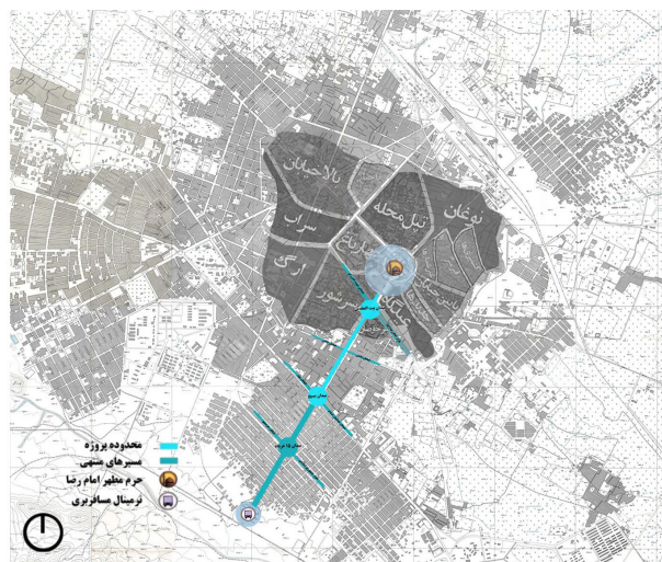
تصویر ۲. موقعیت خیابان امام رضا (ع) در شهر مشهد. مأخذ: نگارندگان.

پس از انقلاب اسلامی کانون توجه و توسعه بار دیگر به جهت