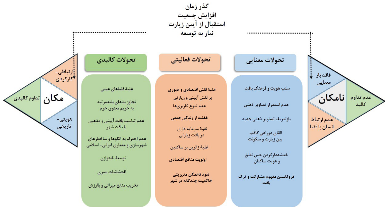
تصویر ۶. ارزیابی عوامل تأثیرگذار کالبدی، فعالیتی و معنایی بر سیر تبدیل مکان به نامکان در محور امام رضا (ع).