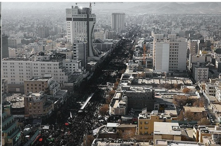
تصویر ۴. خیابان تهران در گذر زمان. مأخذ: www.zibasazi.mashhad.ir.

جدول ۲. بررسی اقدامات کالبدی و آثار و نتایج آن بر بافت پیرامونی مکان مقدس. مأخذ: نگارندگان.