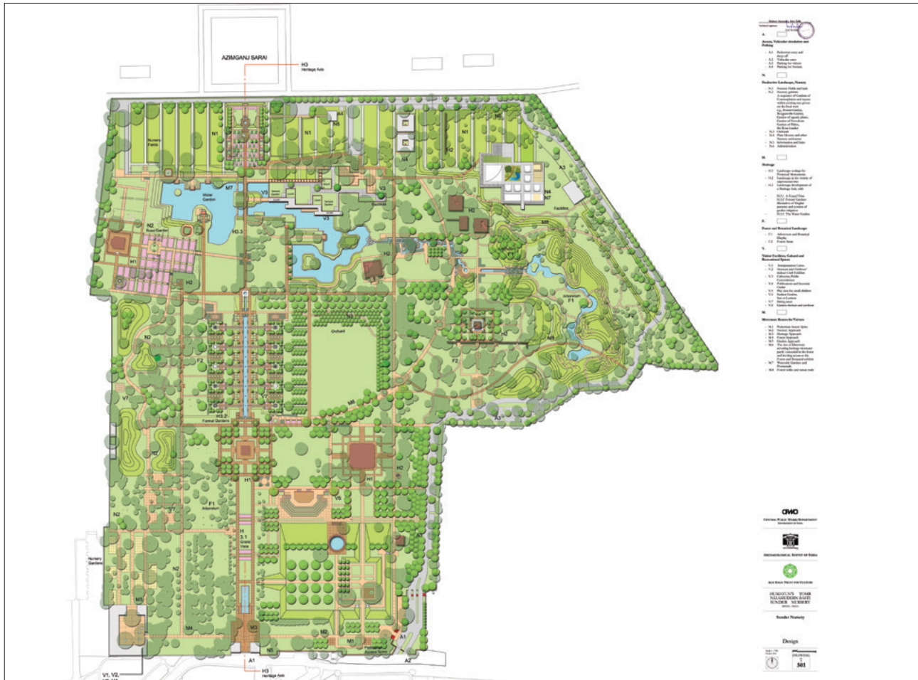
تصویر ۶: پلان محور مرکزی ساندر نرسری.

ایجاد یک فضای گسترده منظرین در مقیاس شهری بود که بر اساس فرهنگ هندی، بر تناسب، و نه جدایی بین طبیعت، باغ، سودمندی و حفاظت از محیط زیست استوار بود و فضاهایی برای تفریح عمومی با عملکردها و الگوهای رفتار شهری مختص دهلی فراهم می کرد (Shaheer Associates, 2008).