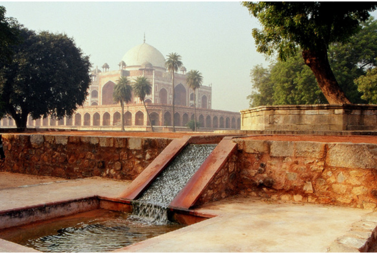
تصویر ۲: باغ مقبره همایون پس از بازسازی، جزئیات جوی آب.

به جزئیات باعث شد که او نه تنها برای هر قطعه از باغ سطحی مشخص کند بلکه برای اطمینان از این که آب باران جمع شده به سرعت از طریق چهار مجرای جمع‌آوری آب به سمت آب‌خوان‌ها هدایت شود، برای هر قطعه شیب جداگانه مشخص کرد. اکثر معمارانی که می‌شناختم برای کل باغ، یا در نهایت برای هر ربع از آن یک سطح تراز پیشنهاد داده و به همان بسنده می‌کردند؛ اما شهیر با حفظ حتی ۱۰ میلی‌متر اختلاف سطح، نه تنها اصالت پروژه را حفظ کرد بلکه به میزان قابل توجهی میزان کار مورد نیاز را کاهش داد.