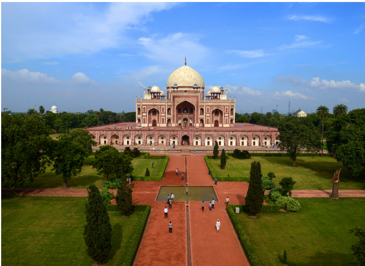
تصویر ۱: باغ مقبره همایون پس از بازسازی، محور اصلی.