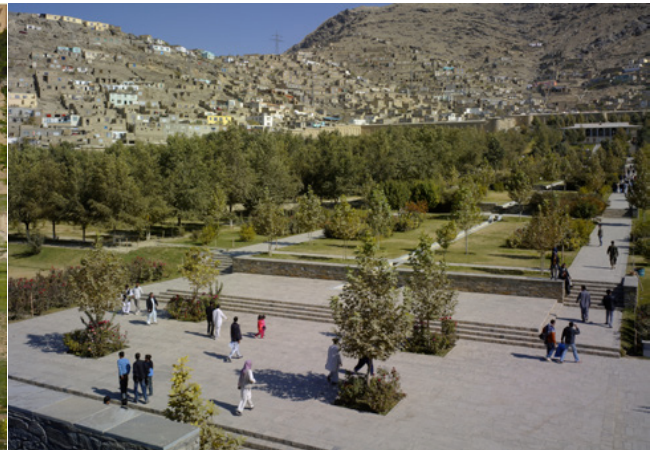
تصویر ۳: باغ بابر پس از بازسازی.

سایت، تراس‌ها سطح‌بندی شده؛ سطوح همواری برای باغ میوه و شیب ملایمی در بین این سطوح به وجود آمد. نهرهای روباز که برای آبیاری به کار می‌رفت با طرحی دقیق جایگزین شدند که در آن برای آبیاری هر تراس، لوله‌کشی زیرزمینی انجام گرفت و پس از آن آب در نهرهایی روباز جریان پیدا می‌کرد. به این ترتیب در حین حفاظت از آب، جلوه بصری که در اثر جریان آب به وجود می‌آمد باقی می‌ماند (تصویر ۵).