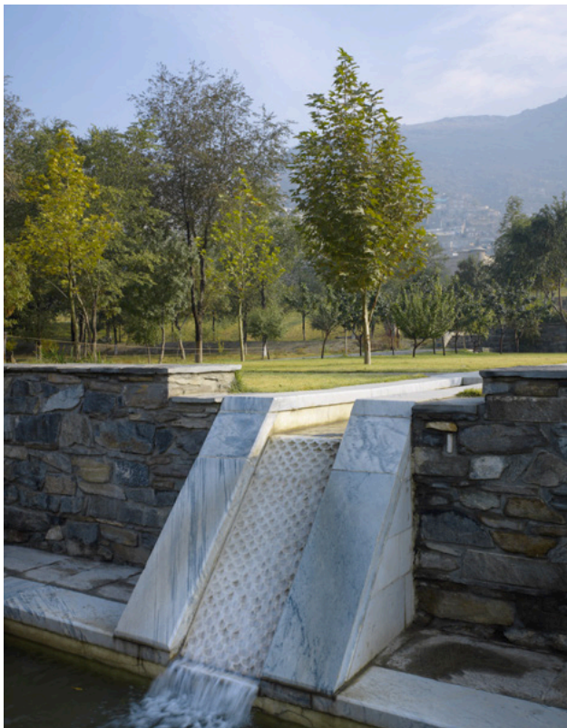
تصویر ۵: باغ بابر، جزئیات جوی آب پس از بازسازی.

نهال‌های موردنیاز را در تابستان علامت‌گذاری کرده و آن‌ها را در گل‌خانه‌های حومه شهر کاشتند؛ و پیش از بهار آن‌ها را به باغ بابر آورده و در بشکه‌های بزرگ کاشتند. از میان آن‌ها گیاهانی که سالم ماندند را همراه با خاک کاشتند بدون اینکه نیازی به جدا کردن نهال‌ها از خاک باشد. این روش، که با اصرار ما، توسط باغبان‌های افغانستان به کار گرفته شد، تقریباً ۱۰۰ درصد موفق بود و باعث تعجب و رضایت همه شد.