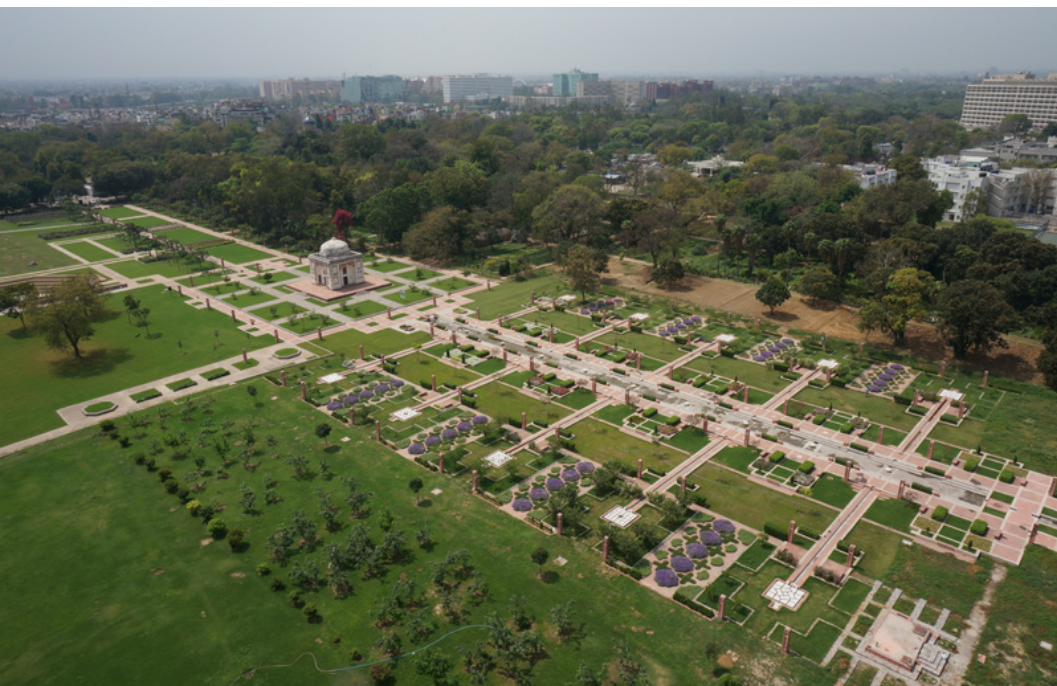
تصویر ۷: منظره هوایی محور مرکزی ساندر نرسری.

باغ از فراز سکوی برج ساندر، همچون فرش گسترده است» (Shaheer & Nanda, 2015); (تصویر ۷).