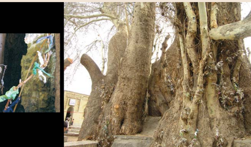
۴- درخت دخیل، چشمه علی دامغان