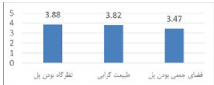
نمودار ۲: نمودار مقایسه معیارهای ارزیابی پل طبیعت در بازه‌های سنی تعریف شده. مأخذ: نگارندگان. Diagram2: The diagram of comparison of bridge evaluation criteria in defined age ranges. Source: authors.