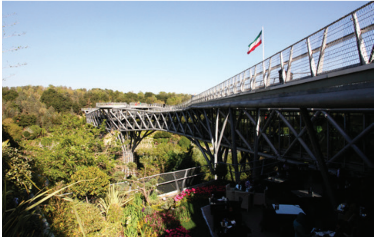
تصویر ۴ Pic4

Pic4: The massive steel bridge among the nature.