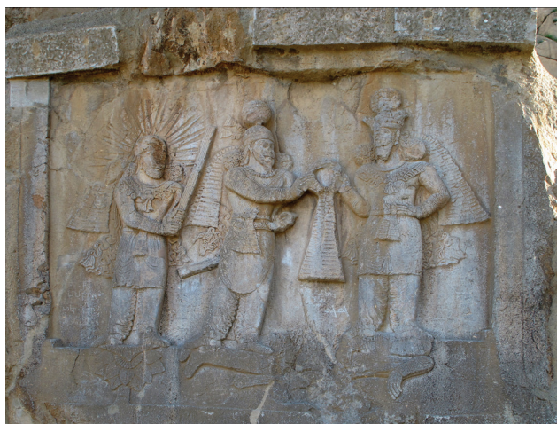
تصویر ۸. تاج‌گیری اردشیر دوم از اهورامزدا با حضور ایزد مهر-میترا.