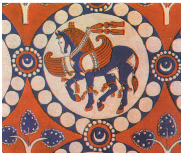
تصویر ۳. نقش اسب و بز با دیهیم و گردنبند مروارید بر پارچه ساسانی. مأخذ: جوادی و آورزمانی، ۱۳۹۵.