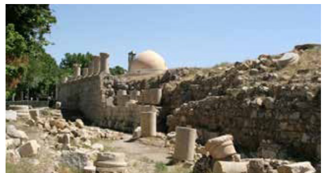
تصویر ۱۲. معبد آناهیتا، کنگاور.