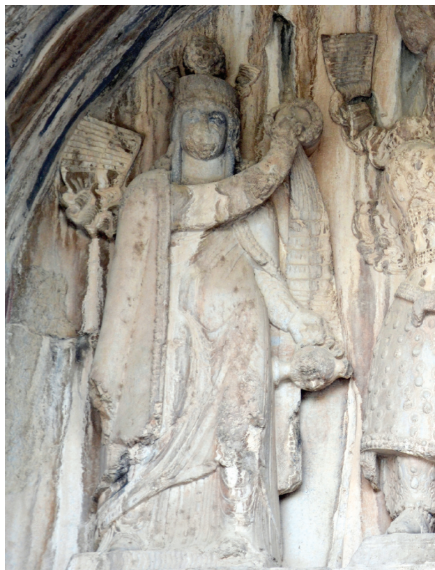
تصویر ۷. ایزدبانو آناهیتا در نقش برجسته تاق بستان با تاجی از مروراید به همراه کوزه آب.