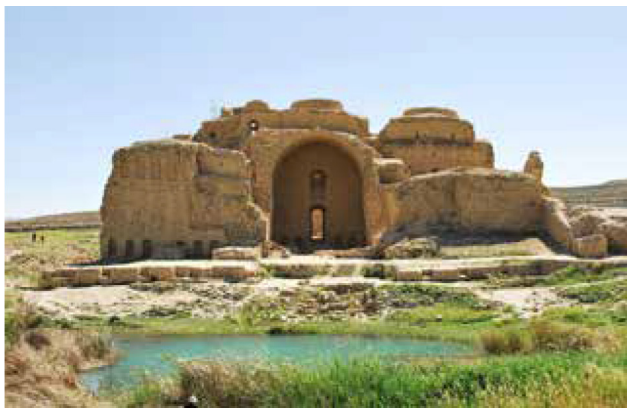
تصویر ۱. کاخ اردشیر، فیروزآباد-فارس.

با نقش برجسته‌هایی از ایزدان مهر، آناهیتا و اهورامزدا در صحنه‌های تاج‌ستانی و شکار شاه به انواع نقش و نگارها و نمادهای طبیعی آراسته شده‌اند. مجموعه این بناهای مذهبی-حکومتی در دل صخره‌های شکوهمند و مقابل چشمه‌ای جوشان واقع شده که درختان کهنسال گرداگرد آنان را دربر گرفته و باغ معبد و شکارگاه شاه را تقدس بخشیده است. نیایش، تاجگذاری و شکار از رسوم و آیین‌های باشکوه شاهان ساسانی بوده که بر سنگ‌نگاره‌هایشان ثبت کرده‌اند. سی و چهار صحنه از نقش برجسته‌های ساسانی در ارتباط با طبیعت از اسناد مهم و باارزش حکومت مذهبی-سیاسی این دوران است که ردپای دین و باورهای طبیعت‌گرای آنان را آشکار ساخته است.