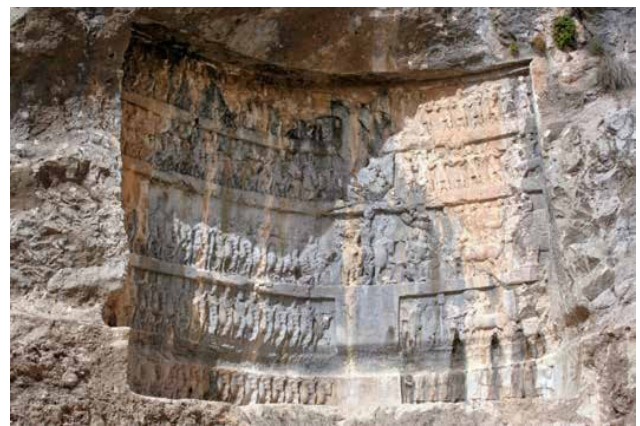
تصویر ۱۰. نقش برجسته تنگ چوگان. مأخذ: آرشیو پژوهشکده نظر، ۱۳۸۸.