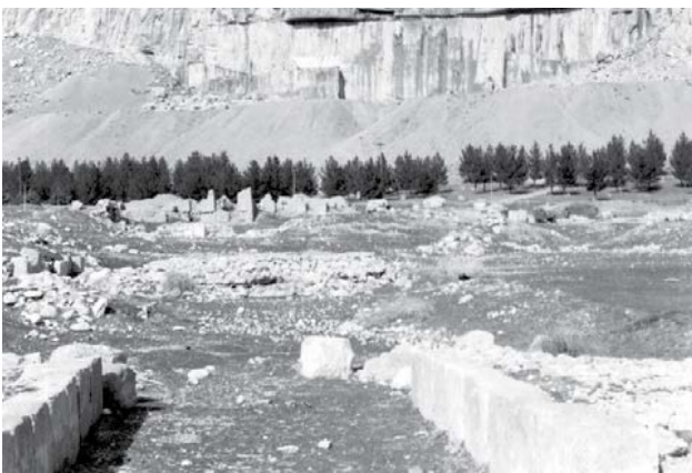
تصویر ۱۱. صفت فرهادتراش.