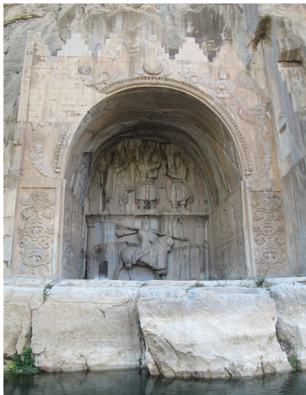
تصویر ۶. تاق بستان.

در گذشته آبی در این مکان جاری بوده و امروز حمام و مسجدی در نزدیکی این مکان وجود دارد که نشان می‌دهد از گذشته تا کنون مکانی محترم بوده و مجاورت آن با آب، ارتباط با آناهیتا، الهه باروری و نگهبان آب‌ها را آشکار می‌سازد. از این مکان با تعلق به دوران اشکانی-ساسانی به عنوان شکارگاه نیز یاد شده است. البته مغایرتی بین شکارگاه و نیایشگاه نیست، زیرا در زمان ساسانی هر دو در کنار هم وجود داشته‌اند. چنانکه