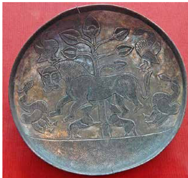
تصویر ۲. ظروف ساسانی با نقوش گیاهی.