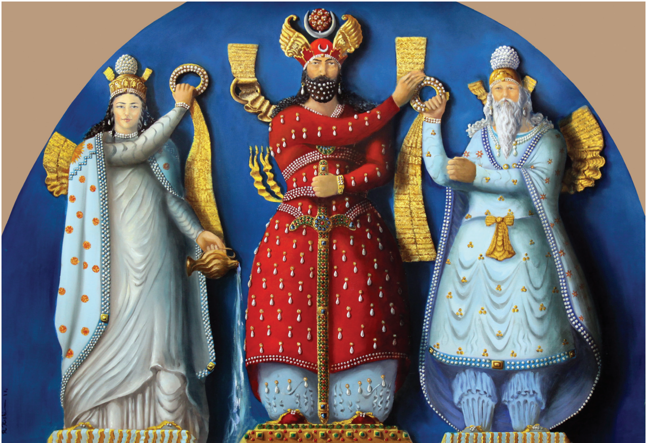
تصویر ۹. نقوش لباس شاهان و ایزدان ساسانی.